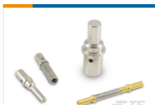
TE 产品编号0462-201-20141 DEUTSCH 实芯端子