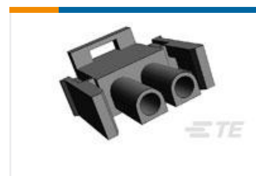
TE 产品编号1-480698-0 02P UMNL PLUG HSG NATL