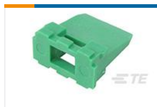
TE 产品编号W6P WEDGE LOCK, 6P, REC, GRN, DT