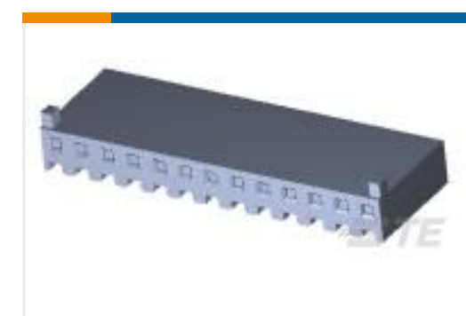
TE 产品编号1-770996-3 13P SL 156 HSG W/TABS W/O LR