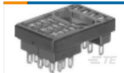
TE 产品编号 2-1393143-1 27E193=SOCKET,R10,11,PC,PHEN