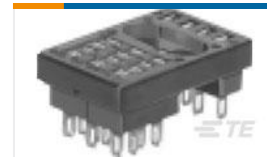
TE 产品编号 3-1393143-6 27E342=SOCKETS