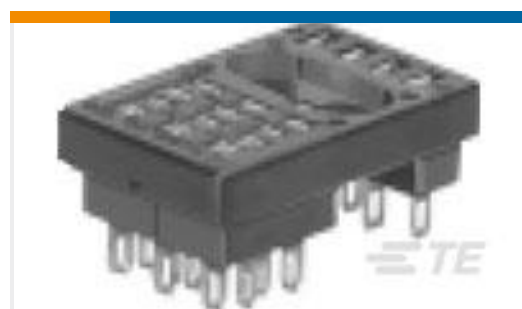
TE 产品编号 4-1393143-1 27E446=SOCKETS