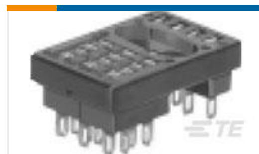
TE 产品编号 5-1393143-0 27E636=SOCKETS