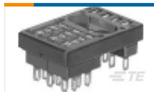
TE 产品编号 1-1393143-1 27E128=SOCKET,R10,10,PC,PHEN