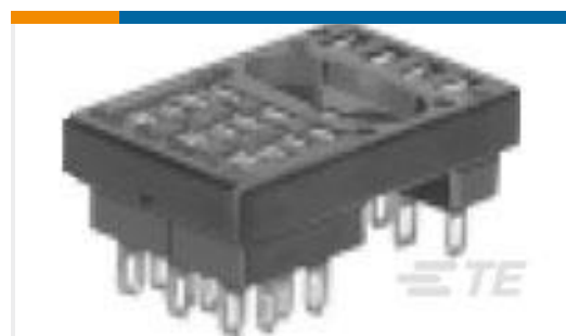
TE 产品编号 1393143-8 27E125=SOCKET,R10,10,SLG,PHE