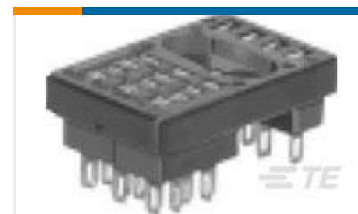
TE 产品编号 2-1393143-4 27E212=SOCKET,R10,10,PC,PHEN