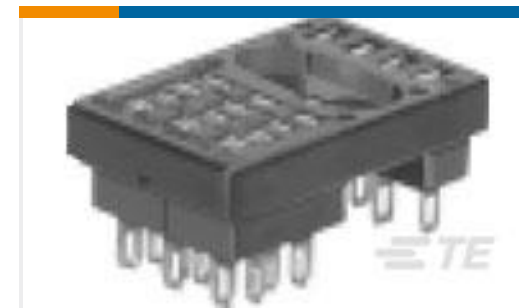
TE 产品编号 3-1393143-4 27E317=SOCKETS