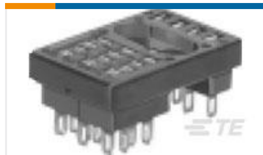
TE 产品编号 1-1393143-6 27E162=SOCKET,R10,10,SLG,PHE