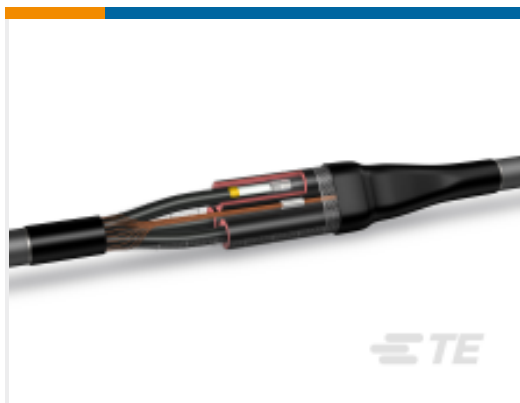
TE 产品编号A69078-064 POLJ-12/3X70-150