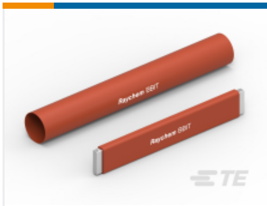
TE 产品编号560936-000 母线绝缘管高达 35 kV