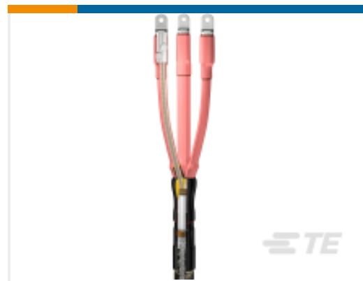
TE 产品编号C47372-064 GUST-12/25-50/800