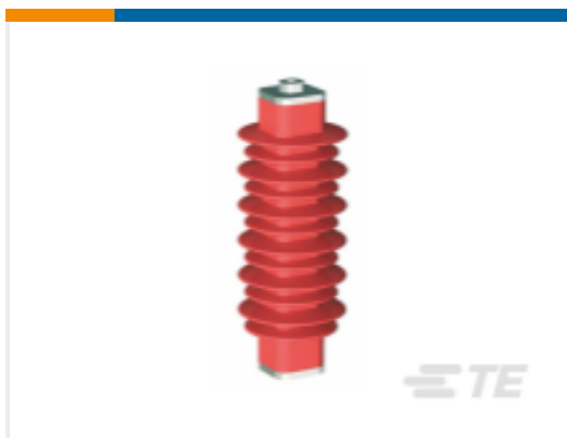
TE 产品编号EN6028-000 HDA-33M-B3-NFF