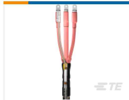
TE 产品编号A31452-070 GUST-12/70-120/800-L12