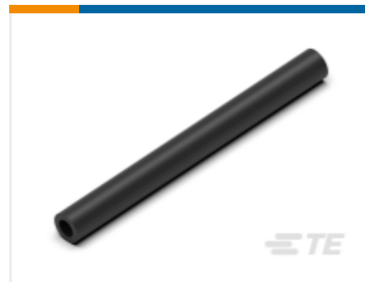
TE 产品编号CN5946-000 EN-CGAT-6/2-0-1200