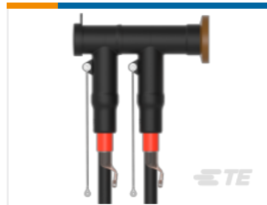
TE 产品编号CM0097-005 RSTI-CC-5854