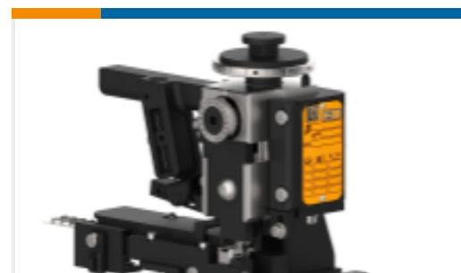
TE 产品编号2266742-1 OCEAN_2.0_Applicator-S-078F132O