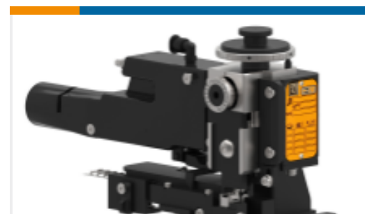
TE 产品编号2266403-2 OCEAN-2.0-APPLICATOR-S- 250F335OV