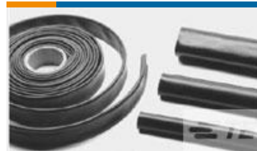
TE 产品编号CB5002-000 BSTS-04X25