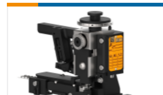
TE 产品编号2836825-1 OCEAN_2.0_Applicator-S-141F215O