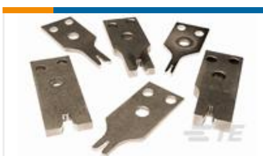
TE 产品编号318542-8 CRIMPER, BLUNT "F"