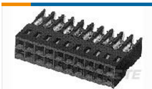
TE 产品编号102398-1 06 AMPMODU MT ASSY DR .100CL