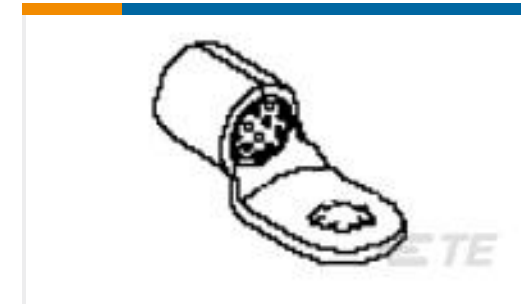
TE 产品编号50720 TERMINAL,COPALUM 8 10