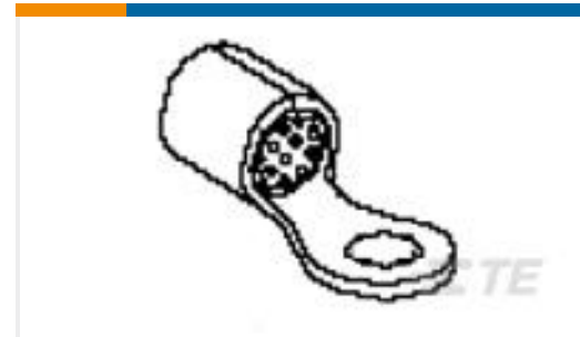
TE 产品编号51979-2 TERMINAL,COPALUM 12-10 10