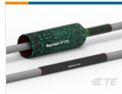
TE 产品编号186312-000 RFSM-95/30-750/123