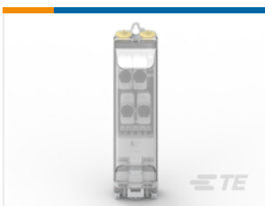
TE 产品编号820560-000 EKM-2051-4D1-5S/U-RK