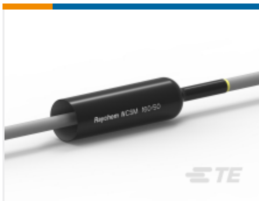
TE 产品编号135998-1 厚壁热缩管