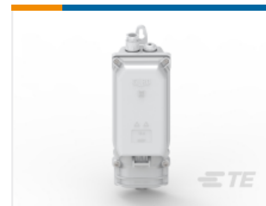
TE 产品编号523562-000 EKM-1281S-2D1-5S/U-2PG-C2