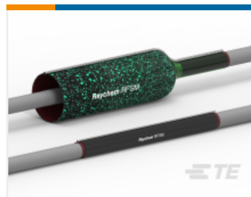
TE 产品编号310667-000 RFSM-95/30-500/123