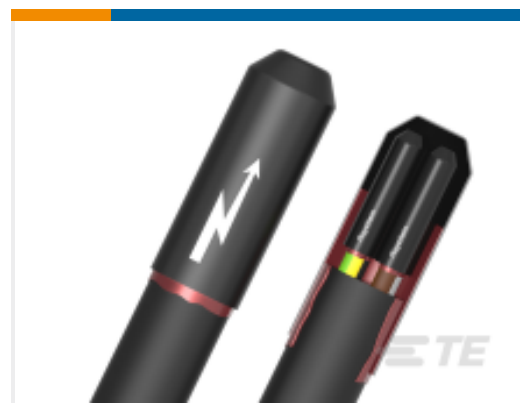
TE 产品编号248047-000 EPKE-0064-DE01