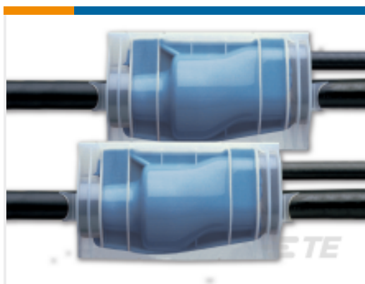
TE 产品编号F24445-000 RAPID-3-D245