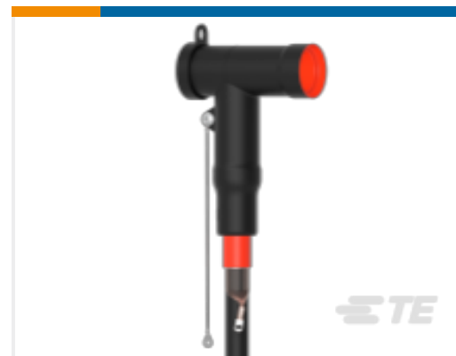
TE 产品编号CM0012-005 RSTI-5854