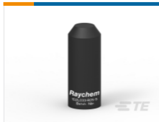
TE 产品编号BM5711N002 102L044-R05/S(S25)