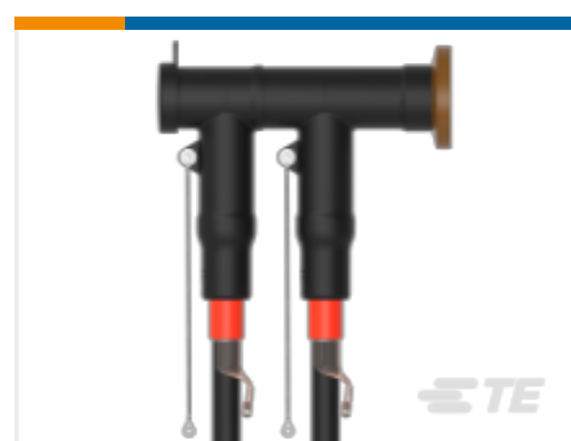
TE 产品编号CM0097-005 RSTI-CC-5854