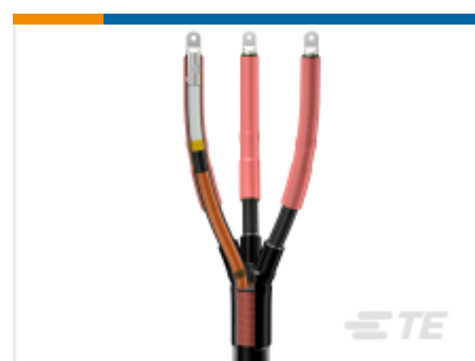
TE 产品编号A96739-013 POLT-12C/3XIH1