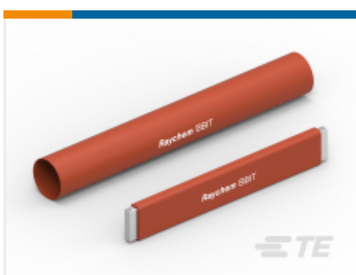
TE 产品编号560936-000 母线绝缘管高达 35 kV