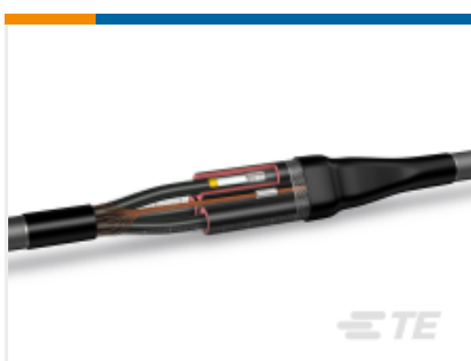
TE 产品编号A69078-064 POLJ-12/3X70-150