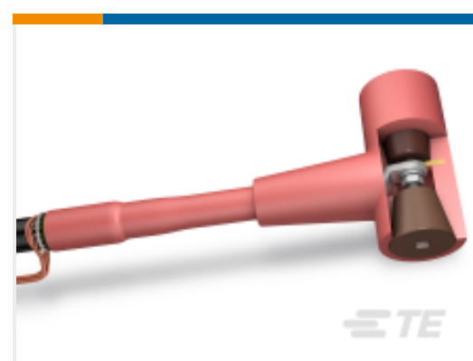
TE 产品编号555340-070 RICS-5123