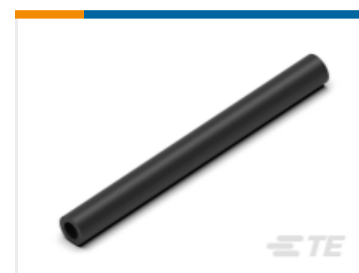
TE 产品编号CN5946-000 EN-CGAT-6/2-0-1200