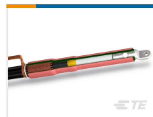
TE 产品编号A00805-070 POLT-12D/1XI