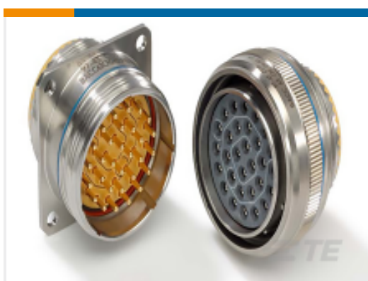
TE 产品编号ZPF000000000007557 983-0SE 14-04 PN-L