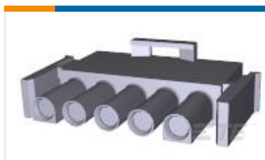
TE 产品编号1-480763-0 05P UMNL PLUG HSG NATL