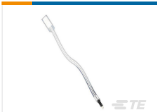
TE 产品编号11031269-00 FDT1-028K W/MALE CONN W/O ADH