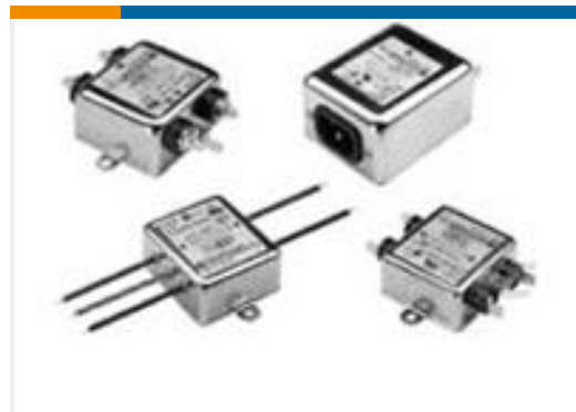
TE 产品编号1-6609027-3 10EK1=F7093 SO