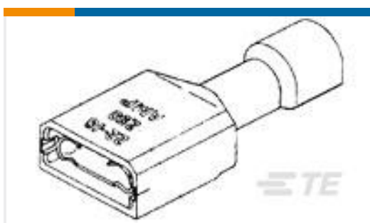
TE 产品编号2-520084-2 ULTRAFAST 110 ASSY REC 22-18 TPBR LP