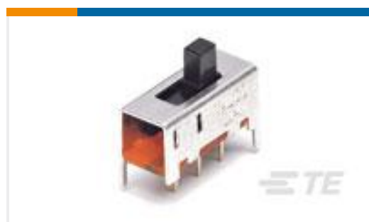
TE 产品编号1571630-2 MSS2250R04=DPDT SL SW R/A AG