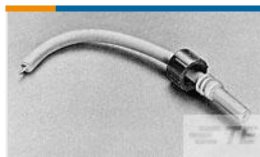
TE 产品编号1-846290-1 LGH-4 LEAD ELECT SGL MLD END