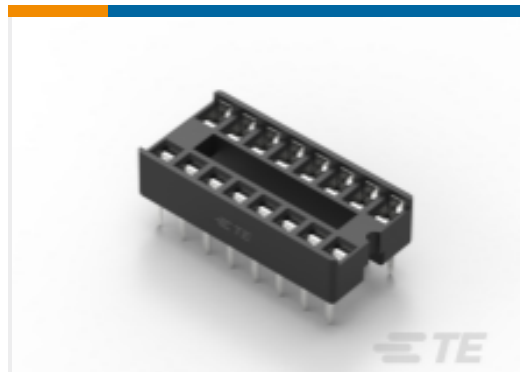
TE 产品编号1-2199298-3 DIP 插座：小尺寸，冲压成型，开放式，锡