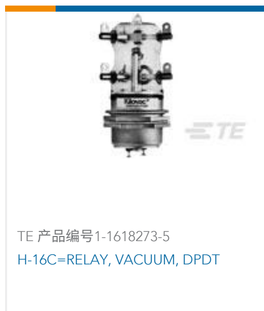
TE 产品编号1-1618273-5 H-16C=RELAY, VACUUM, DPDT