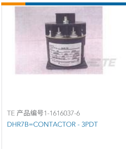
TE 产品编号1-1616037-6 DHR7B=CONTACTOR - 3PDT