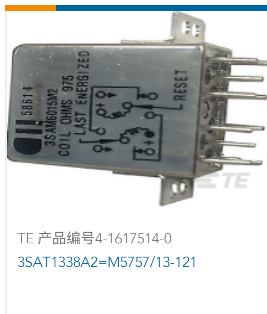
TE 产品编号4-1617514-0 3SAT1338A2=M5757/13-121