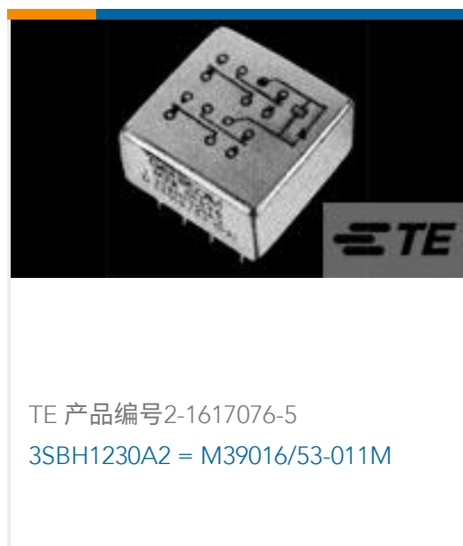
TE 产品编号2-1617076-5 3SBH1230A2 = M39016/53-011M