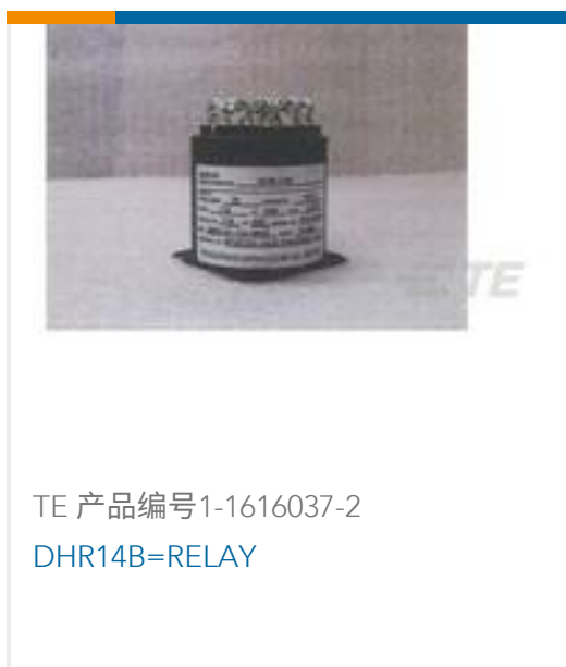
TE 产品编号1-1616037-2 DHR14B=RELAY