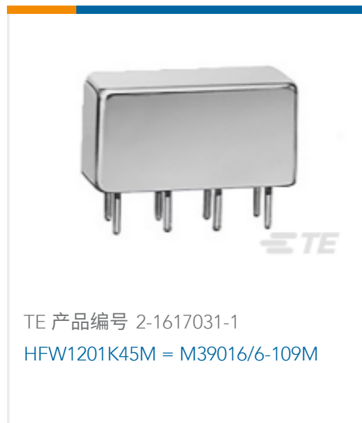
TE 产品编号 2-1617031-1 HFW1201K45M = M39016/6-109M