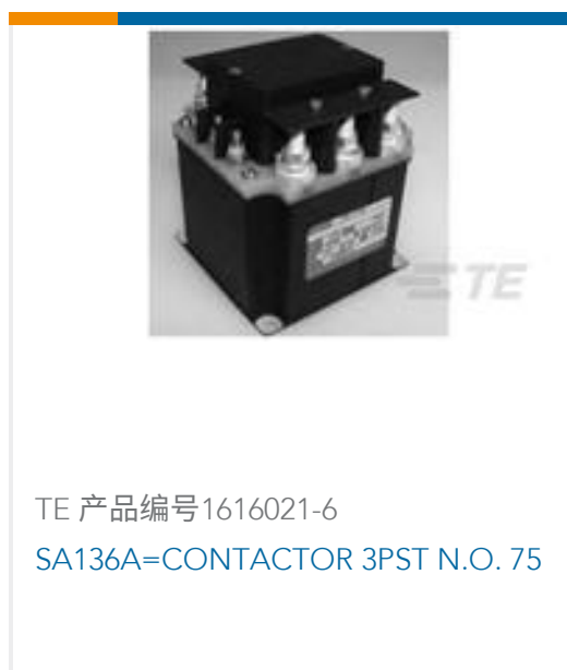
TE 产品编号1616021-6 SA136A=CONTACTOR 3PST N.O. 75