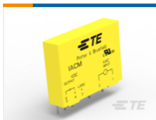
TE 产品编号 8-1393028-8 SLIM INPUT AC MOD,15V DC LOGIC-240VAC IP