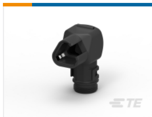
TE 产品编号1011-232-0305 BKSHL, 3P, BLK, PLG, RA, NW6/7.5/8.5 /10