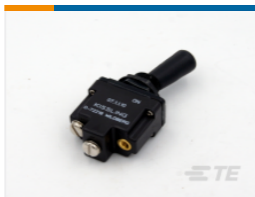
TE 产品编号K1007153 Toggle Switch 08-1-1-13