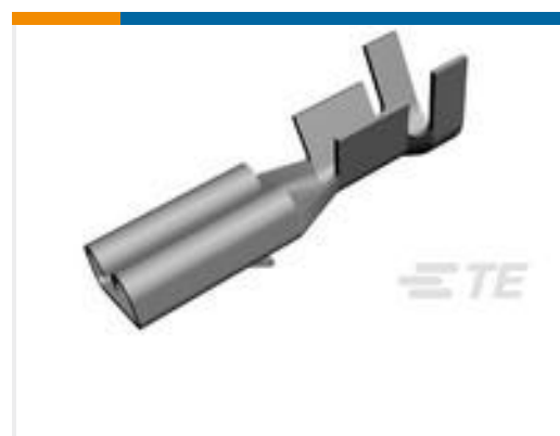
TE 产品编号160668-6 TERMINAL