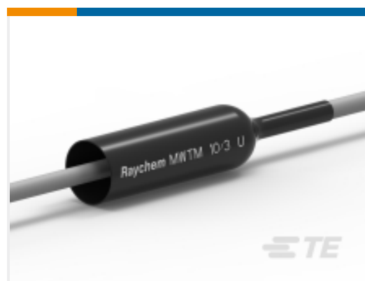
TE 产品编号834936-000 MWTM-10/3-100/S(S100)