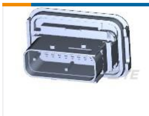
TE 产品编号2-1564532-1 15POS, MIXED,TAB HSG,ASSY