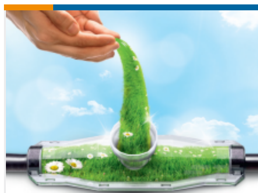
TE 产品编号 EE3379-000 GUROFLEX-N-C170