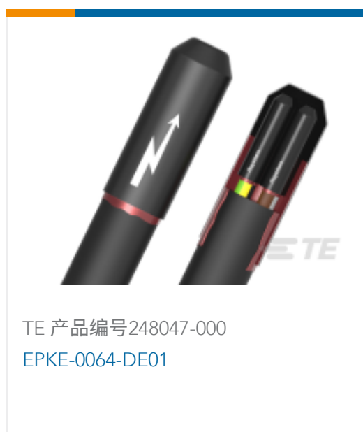
TE 产品编号248047-000 EPKE-0064-DE01