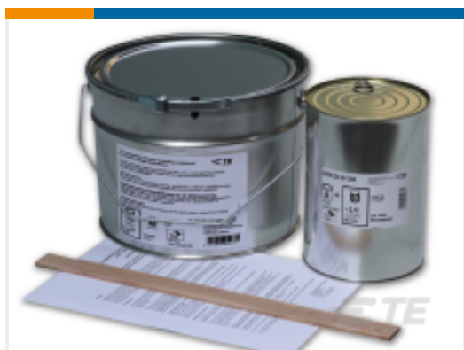
TE 产品编号 E57640-000 GUROFLEX-MV-C1000