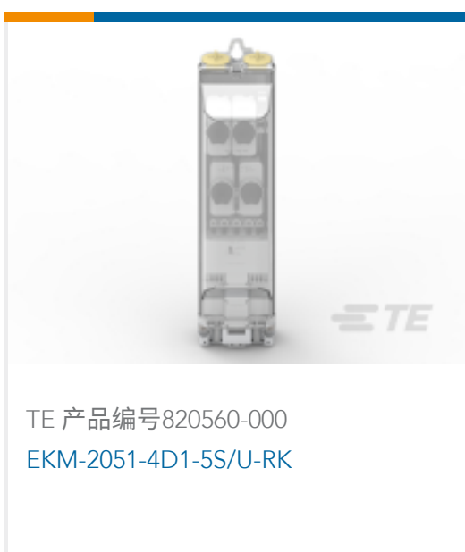
TE 产品编号820560-000 EKM-2051-4D1-5S/U-RK