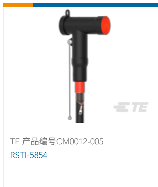
TE 产品编号CM0012-005 RSTI-5854