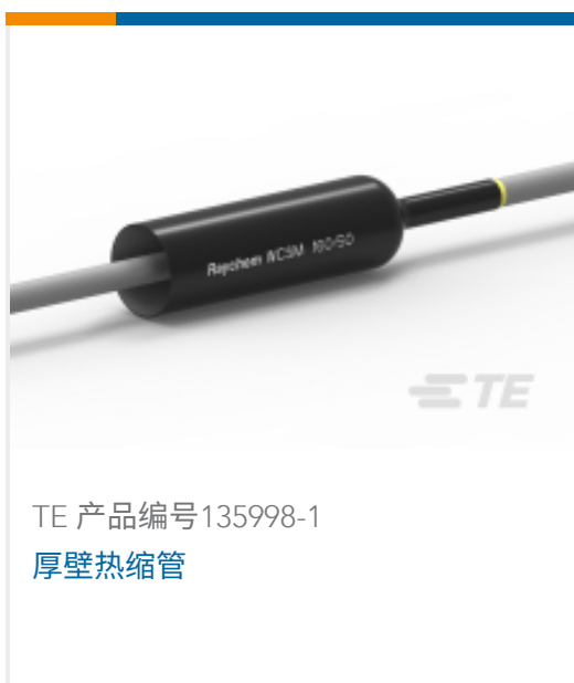
TE 产品编号135998-1 厚壁热缩管