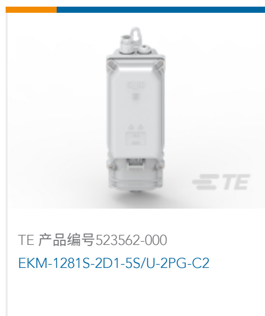
TE 产品编号523562-000 EKM-1281S-2D1-5S/U-2PG-C2