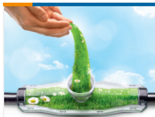
TE 产品编号 EE3382-000 GUROFLEX-N-C385