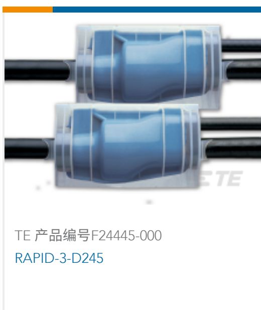
TE 产品编号F24445-000 RAPID-3-D245