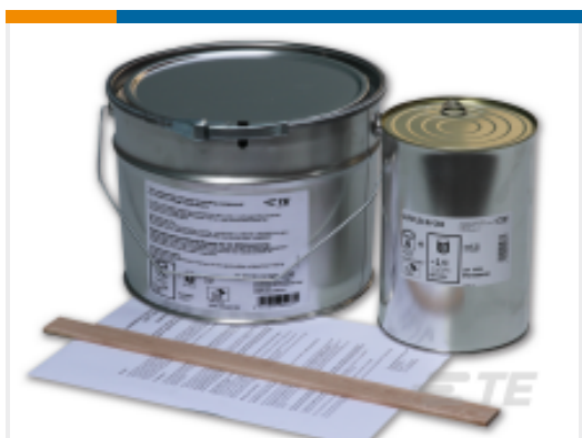
TE 产品编号 EA2308-000 GUROFLEX-MV-C100