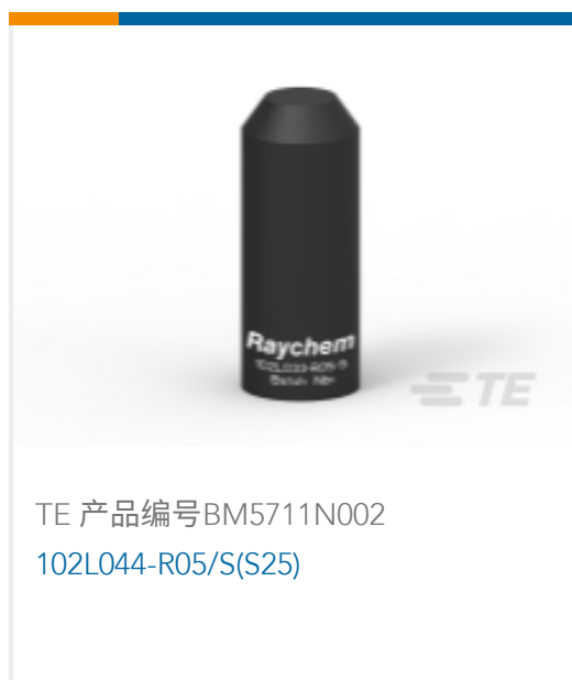
TE 产品编号BM5711N002 102L044-R05/S(S25)