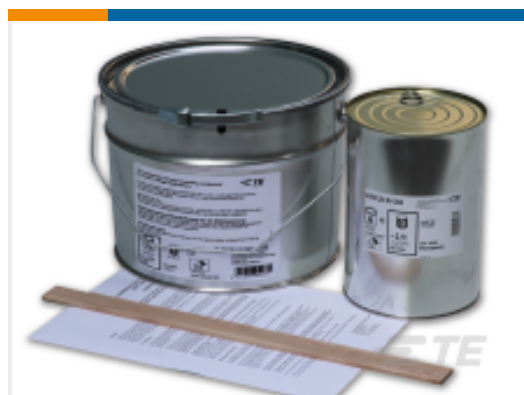
TE 产品编号 C82946-000 GUROFLEX-MV-C530