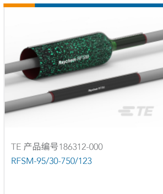
TE 产品编号186312-000 RFSM-95/30-750/123