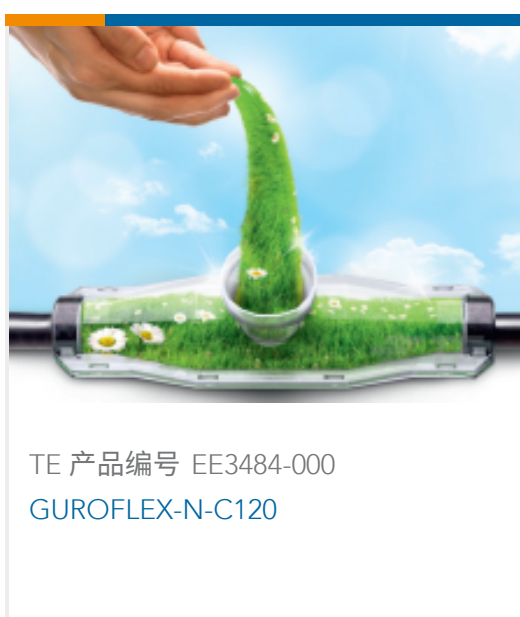
TE 产品编号 EE3484-000 GUROFLEX-N-C120