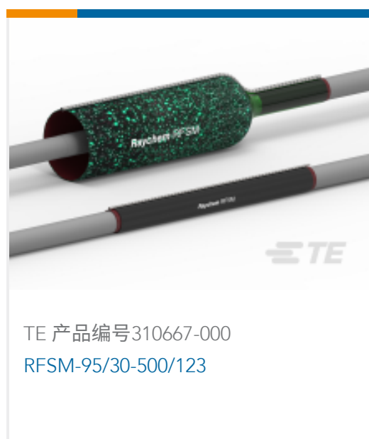
TE 产品编号310667-000 RFSM-95/30-500/123