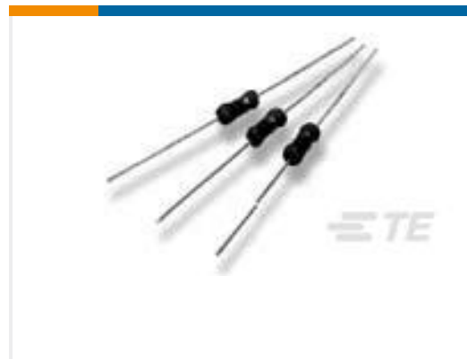
TE 产品编号9-1879352-8 RR02 5% 3K6 AMMO