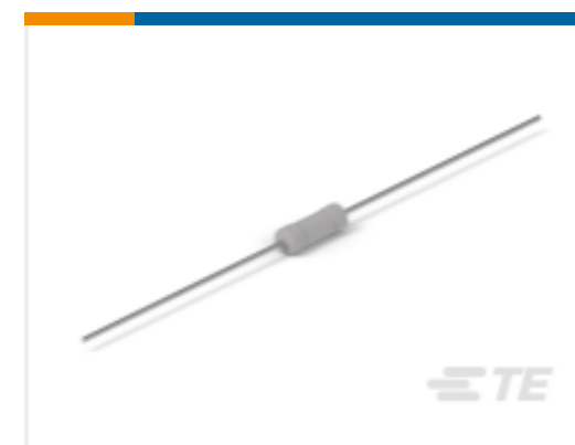
TE 产品编号2-1676123-1 1/2W SM M/OX 5% 5R6