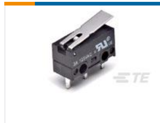
TE 产品编号2-1825043-0 UP3DTBNLB04,MICROSWITCH,SNAP