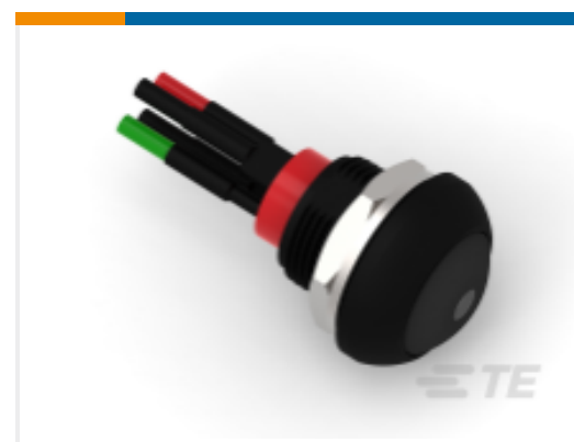
TE 产品编号2329389-3 PB OFF/ON FC BLK M1 TERM YLW LED IP68 50