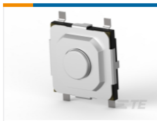
TE 产品编号2337237-2 TACT MINI GW 5.2X5.2X1.5 100GF