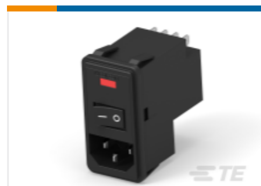
TE 产品编号2-6609951-7 PS0SSSHX0=C4441