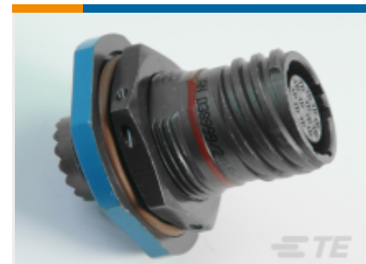
TE 产品编号YACT24JA35SCV00100 JAM NUT RECEPTACLE