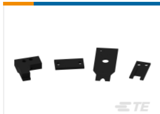
TE 产品编号463310-4 BLADE, STRIPPING #18