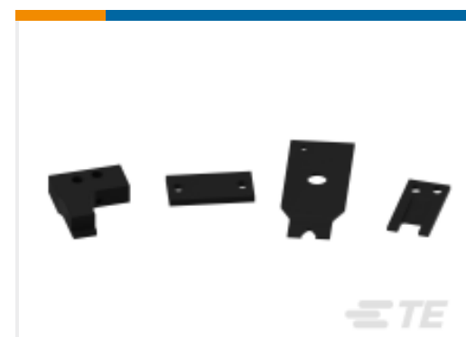
TE 产品编号463310-3 BLADE, STRIPPING #16