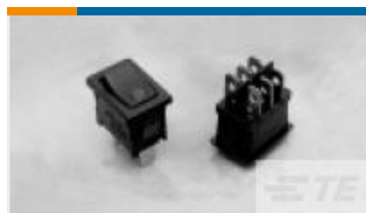
TE 产品编号1-1571091-1 PRBSA1-16F-BW000=POWER ROCKER