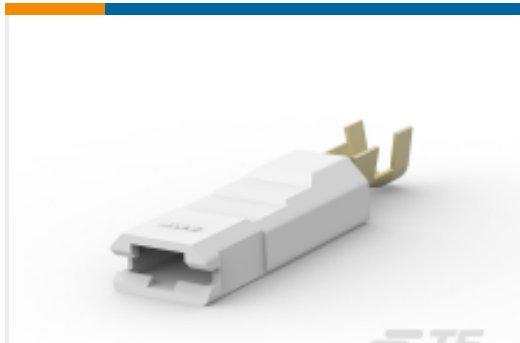
TE 产品编号5-520963-1 ULTRA POD：直形，母端组件，无镀层，0.250 英寸