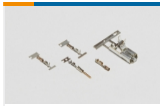
线到板连接器端子(32)