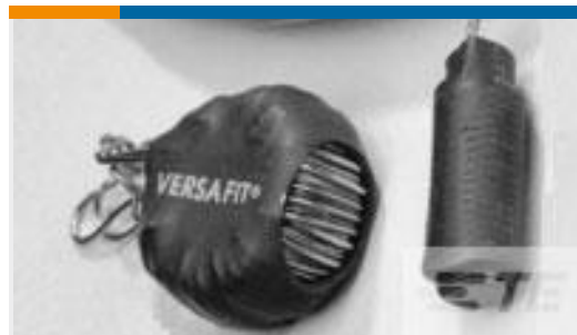
TE 产品编号938365P002 VERSAFIT-1/8-0-0.75IN-ST