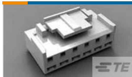
TE 产品编号2-1123722-3 3.96 EP PLUG HSG 3P(YELLOW)