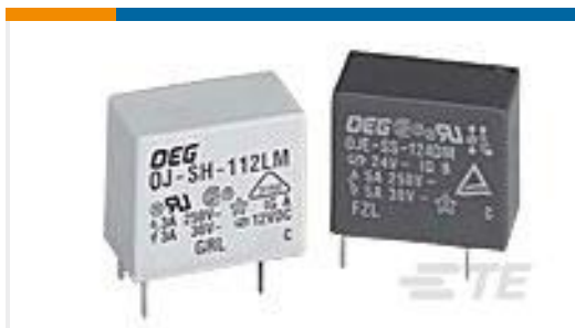
TE 产品编号1461247-1 OJ-SH-106LMH,000