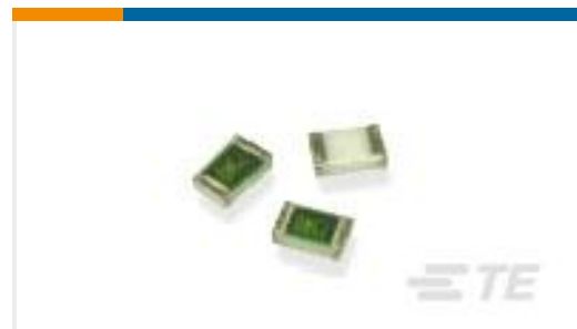
TE 产品编号1676701-2 RN 0805 47R5 0.1% 10PPM 1K RL