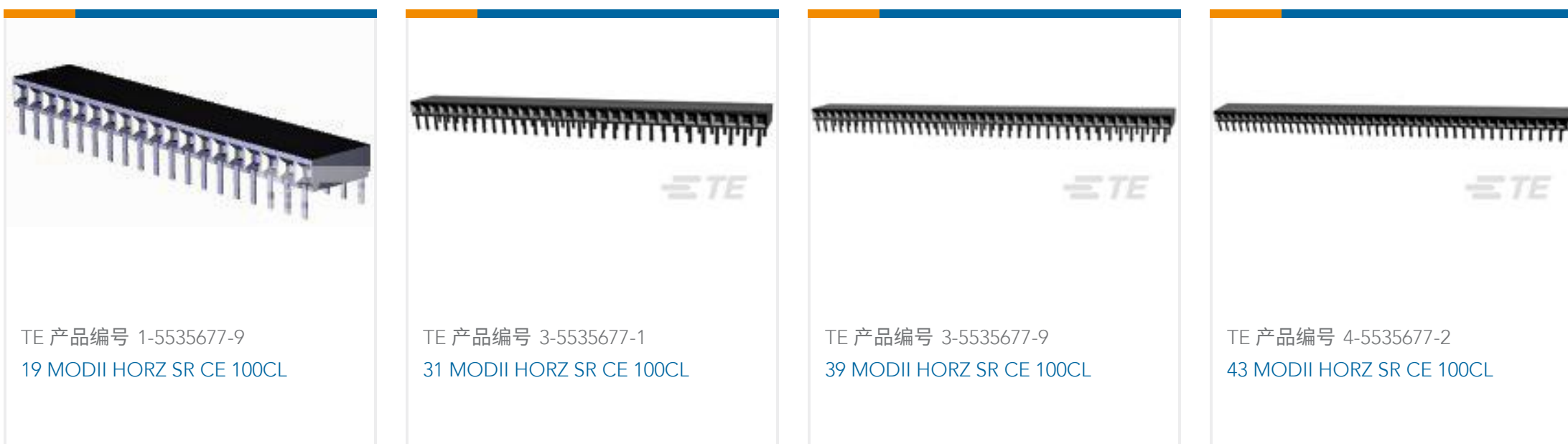
TE 产品编号 1-5535677-9 19 MODII HORZ SR CE 100CL