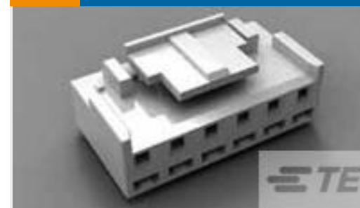
TE 产品编号1-1123722-8 3.96 EP PLUG HSG 8P(NATURAL)