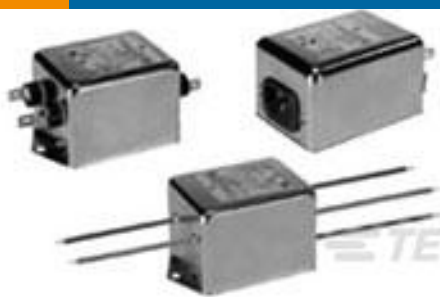
TE 产品编号1-6609037-0 20EP6=F7810 S0