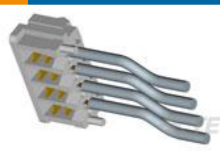
TE 产品编号1-173977-0 CT CONN MT REC ASSY 10P