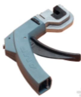
TE 产品编号 58074-1 MTA 50/100/156 MANUAL TOOL FRAME