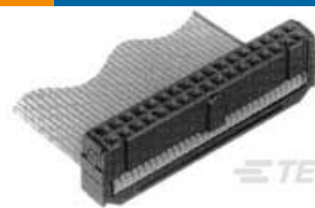
TE 产品编号1-1658622-1 60 NOVO MIL/CTR 30DP, LEAD FREE