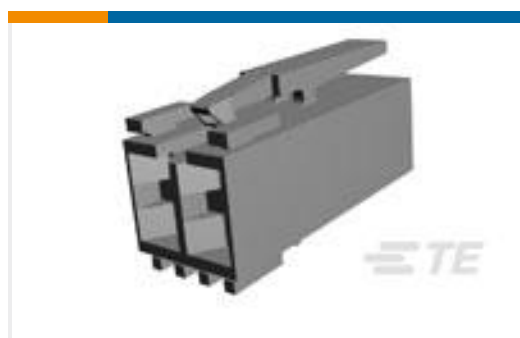
TE 产品编号1241961-1 STD TIM HOUSING MKII 2POS