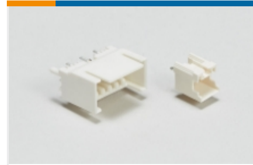
线到板接头和插座(424)