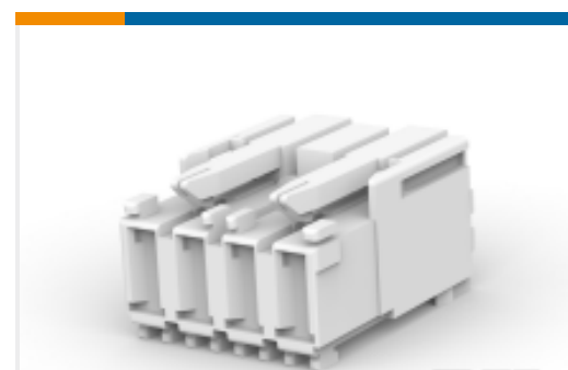
TE 产品编号1-1534072-4 MULTIF.ASSY MK2 4P, AR