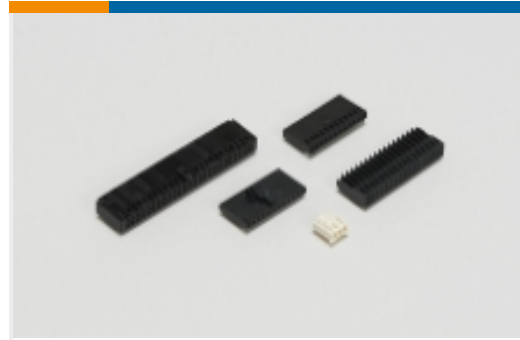
线到板连接器组件和护套(214)