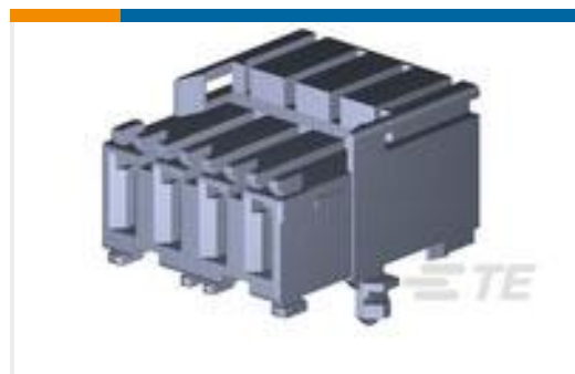
TE 产品编号1534077-4 MULTIFITING MK2 ASSY,4POS