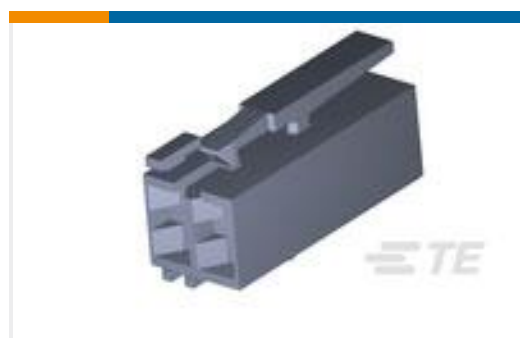
TE 产品编号3-1241961-2 STD TIM HOUSING MKII 2POS