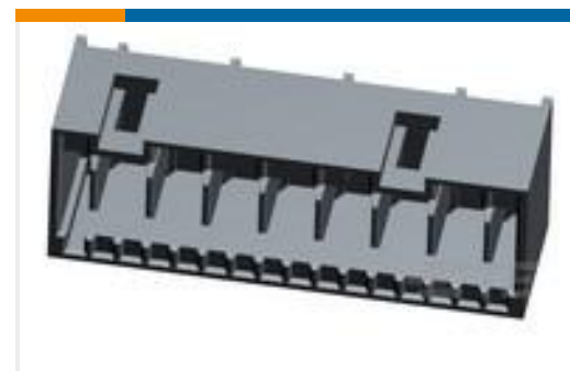
TE 产品编号2-1971845-8 8P, RAST 5 Tab Header, THV