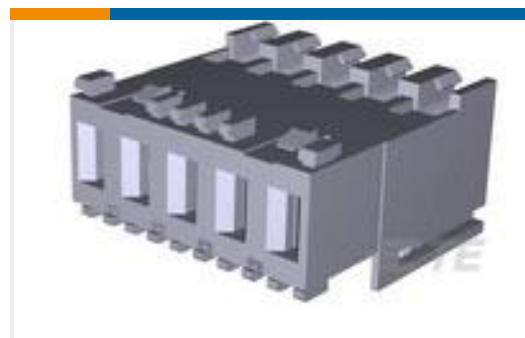
TE 产品编号1394355-5 MULTIFIT MK2ST-ST5P