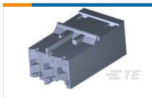
TE 产品编号2-1241981-3 STD TIMER HOUSING 3P (NATURE)