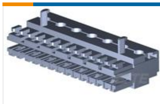
TE 产品编号1394918-7 DUOPLG5.0 BU-STE 7P