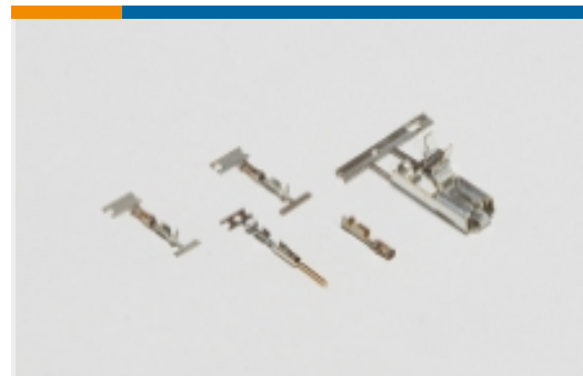
线到板连接器端子(2)