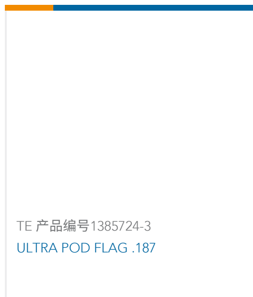
TE 产品编号1385724-3 ULTRA POD FLAG .187