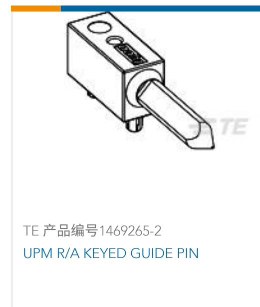
TE 产品编号1469265-2 UPM R/A KEYED GUIDE PIN