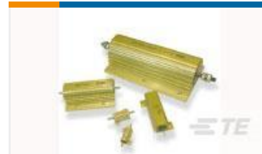
TE 产品编号2-1630024-5 HSC250 6R8 5%