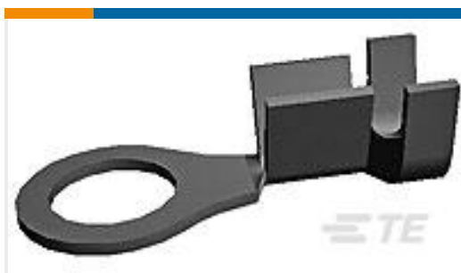
TE 产品编号160787-1 RING TONGUE IS 18-14 AWG .0840 X . 940 BR