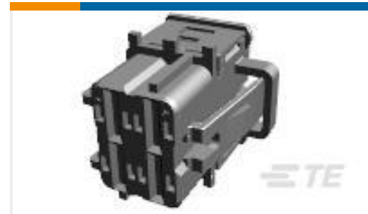
TE 产品编号1534404-2 MCP6.3 RECEP HSG4P