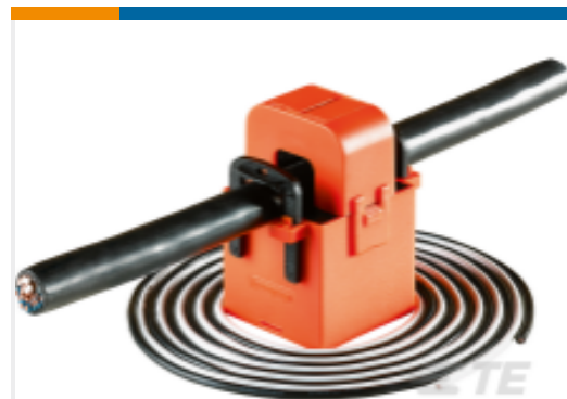
TE 产品编号 EF0763-000 CI-MSC1-75/1