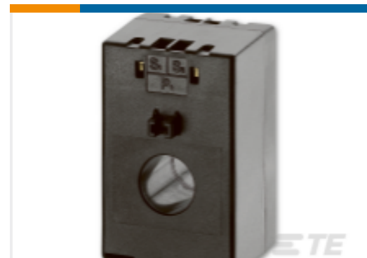
TE 产品编号 EB8966-000 CI-M65F-75/5