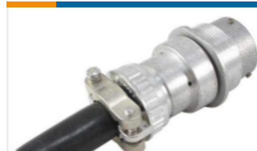
TE 产品编号HD34-18-14SE-059 REC,14P,AL,E, CBL CLMP BT, DRAIN, 16,S,MC