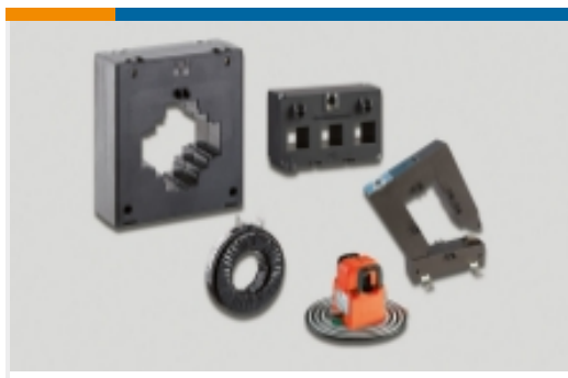
电流变压器和分流器(547)