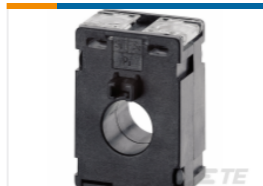
TE 产品编号 EB9309-000 CI-M53Q-75/5A

该系列中的其他产品 | Crompton Current Transformers