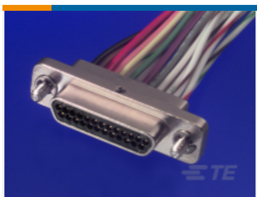
TE 产品编号 1532176-3 M83513/04-F03N, MCKS-N1-B-37S6G9-18.0