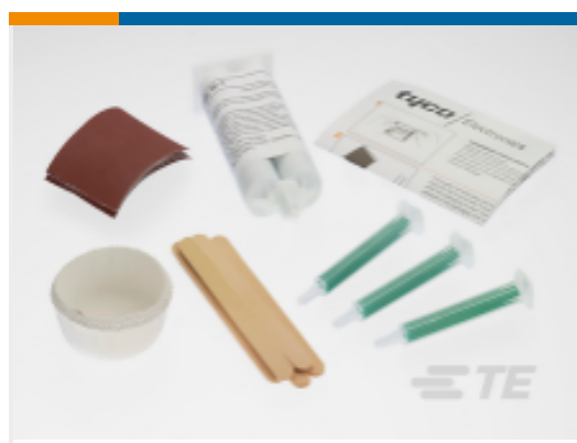
TE 产品编号 657863-000 S1125-KIT-8