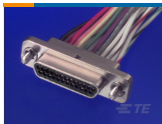
TE 产品编号 1532171-3 M83513/04-A03N, MCKS-N1-B-9S6G9-18.0