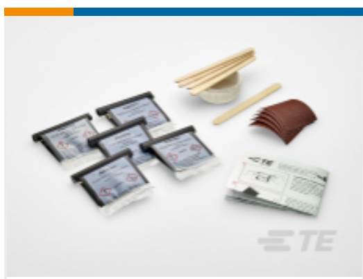
TE 产品编号 583393-000 S1125-KIT-5