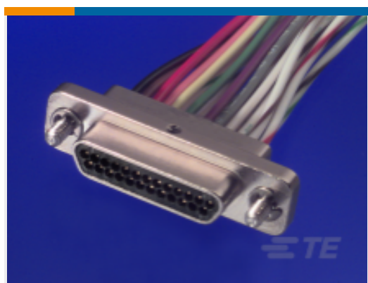
TE 产品编号 1532179-3 M83513/03-A03N, MCKS-N1-B-9P6G9-18.0