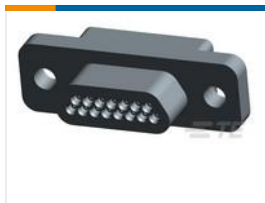
TE 产品编号 1532180-3 M83513/03-B03N, MCKS-N1-B-15P6G9-18.0