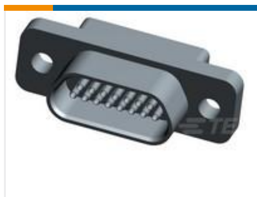
TE 产品编号 1532172-3 M83513/04-B03N, MCKS-N1-B-15S6G9-18.0