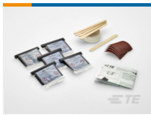
TE 产品编号 878462-000 S1125-KIT-1