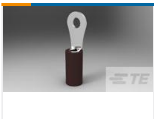
TE 产品编号 1577616-1 TERMINAL, PEEK PIDG STRATO, 24-22AWG