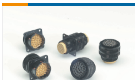
TE 产品编号ZPF000000000100951 FDBA 54-16-26 PN-K 090 A499