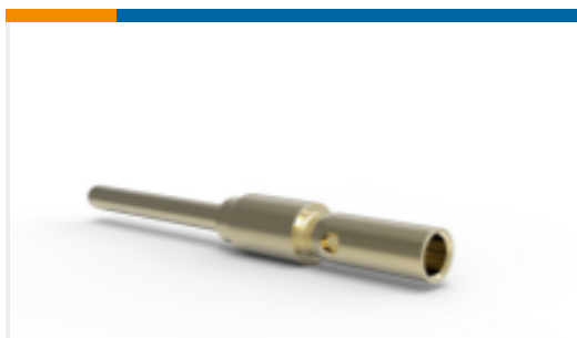
TE 产品编号1-2314102-1 M12 CRIMP CONTACT PIN 1 MM AU 0.8 AWG20