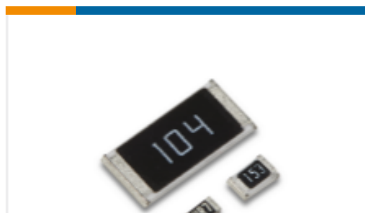
TE 产品编号3-2176348-9 CRGCQ 2010 2M2 5%