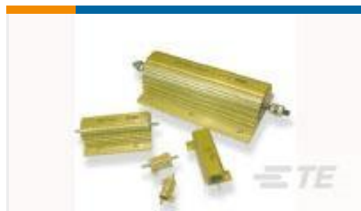
TE 产品编号5-1630186-7 HSA50 2K4 5%