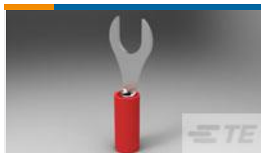
TE 产品编号8-35216-1 PIDG SLTD 22-16COMM 22-18MIL 6