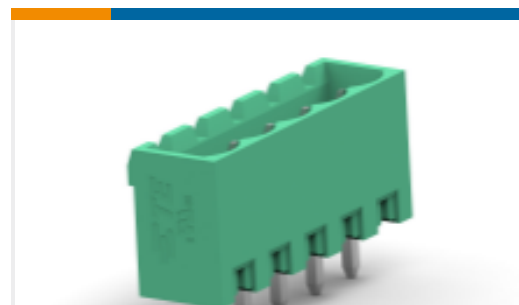
TE 产品编号2351885-2 2POS TB HDR 180 DEG, PITCH 5.0&TL 4.5mm