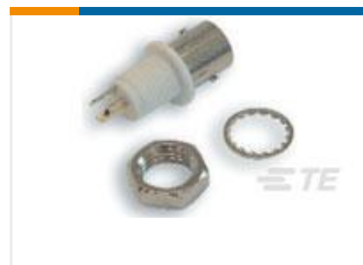
TE 产品编号1-1337448-0 BNC BHSkt + TAG 50Ohm Nickel Pltd