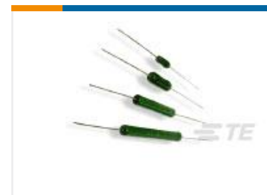
TE 产品编号1-1623773-1 C10 1K0 5% (LOOSE)