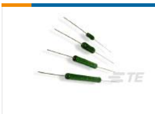
TE 产品编号1-1623773-3 C10 1R0 5% (LOOSE)