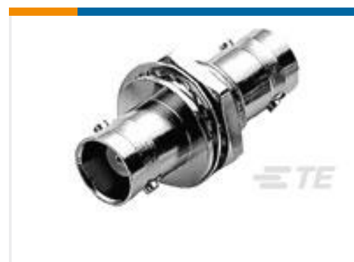
TE 产品编号1-1478045-0 BNC BH Adp JJ 75Ohm Silver Pltd