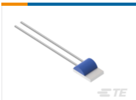
TE 产品编号NB-PTCO-160 Pt100, 2.0x2.3, Class B, PTFC101B1A0