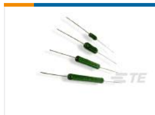
TE 产品编号1-1623773-0 C10 15R 5% (LOOSE)