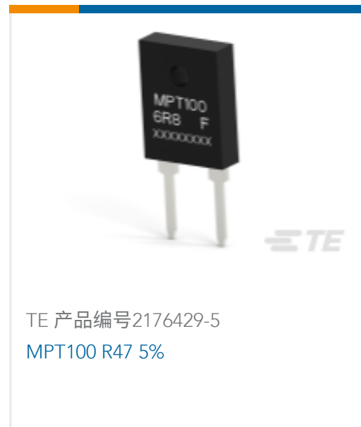
TE 产品编号2176429-5 MPT100 R47 5%