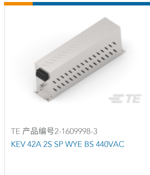
TE 产品编号2-1609998-3 KEV 42A 2S SP WYE BS 440VAC