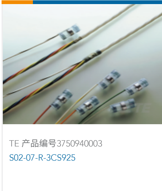
TE 产品编号3750940003 S02-07-R-3CS925