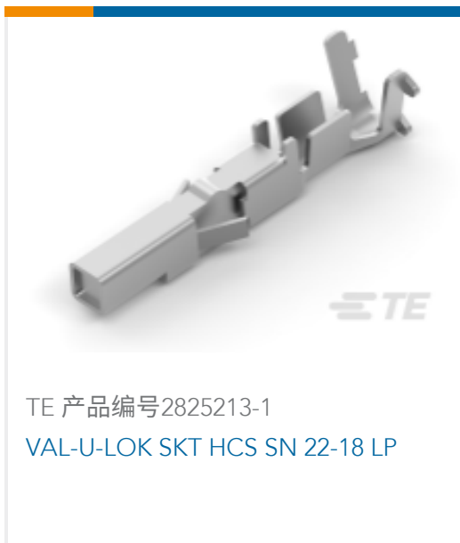
TE 产品编号2825213-1 VAL-U-LOK SKT HCS SN 22-18 LP