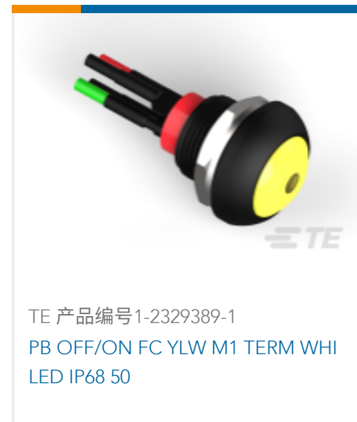
TE 产品编号1-2329389-1 PB OFF/ON FC YLW M1 TERM WHI LED IP68 50