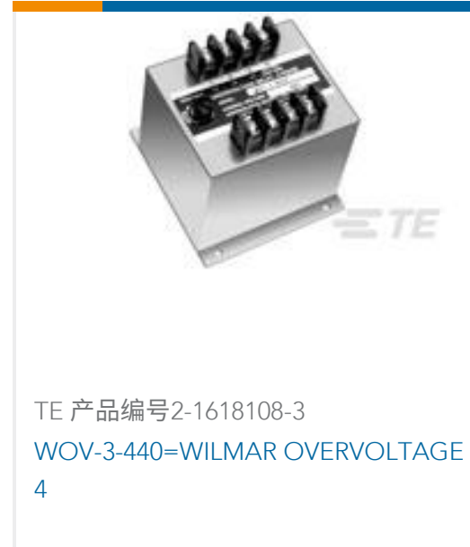
TE 产品编号2-1618108-3 WOV-3-440=WILMAR OVERVOLTAGE 4