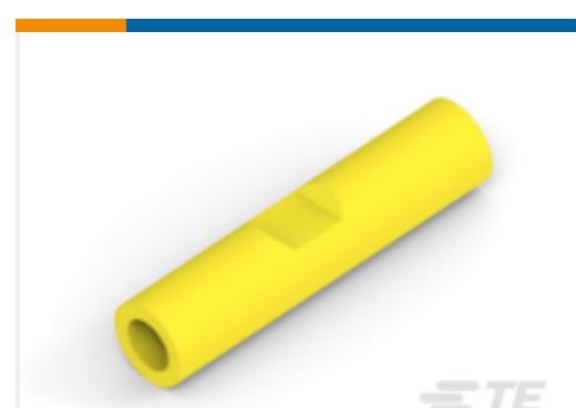
TE 产品编号5-1377173-8 SMP 0-0035115-0