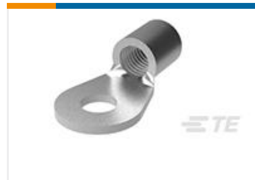
TE 产品编号2-1377172-1 SMP 0-0033465-0