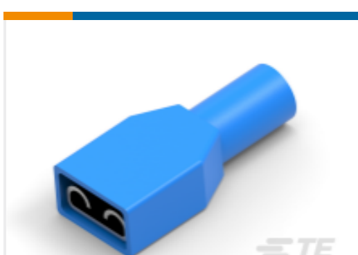
TE 产品编号4-1377175-0 SMP 0-0180901-0