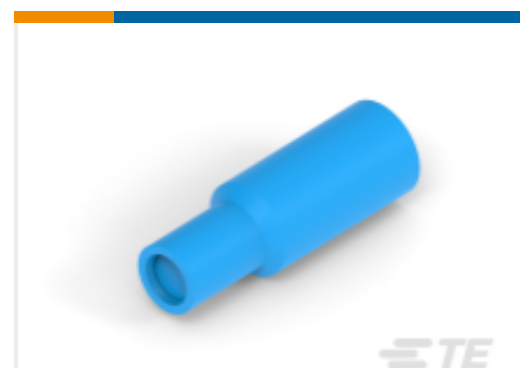
TE 产品编号3-1377174-3 SMP 0-0165400-1