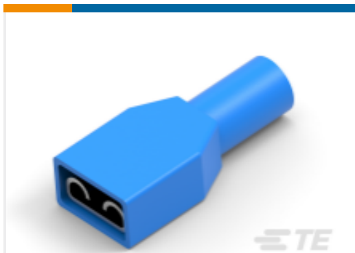
TE 产品编号1377175-7 SMP 9-0160313-5