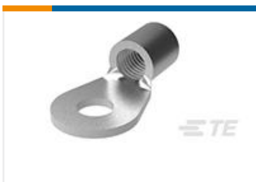
TE 产品编号3-1377172-7 SMP 0-0036919-0