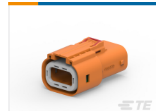
TE 产品编号2103534-4 PLUG SUBASSY, D, HVA280