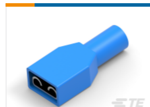
TE 产品编号3-1377175-4 SMP 0-0042241-2