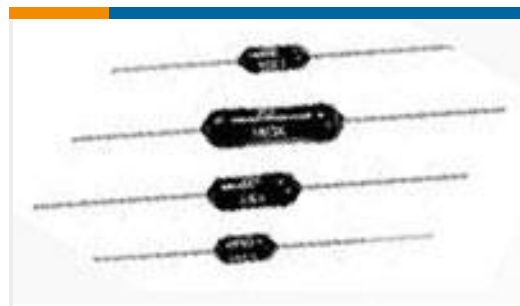
TE 产品编号 9-1879664-1 H8 10K 0.1% 15PPM