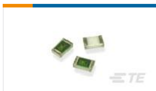
TE 产品编号1676339-2 RN 0805 42K2 0.1% 10PPM 1KRL