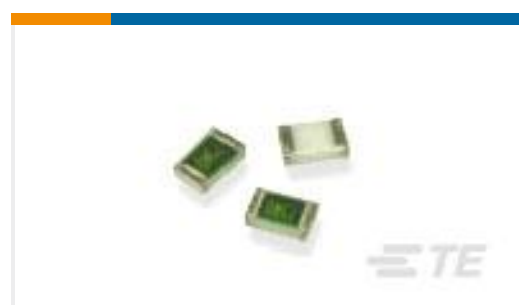
TE 产品编号1676347-2 RN 0805 46K4 0.1% 10PPM 1KRL