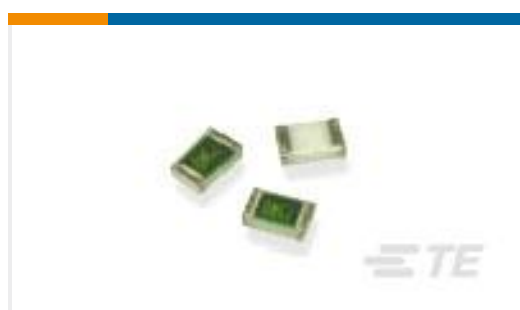
TE 产品编号 1676321-2 RN 0805 39K2 0.1% 10PPM 1KRL