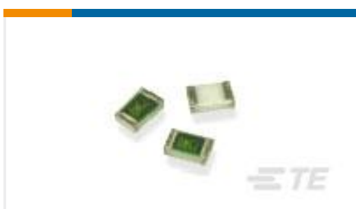
TE 产品编号1676317-2 RN 0805 37K4 0.1% 10PPM 1KRL