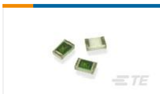
TE 产品编号 1676319-2 RN 0805 38K3 0.1% 10PPM 1KRL