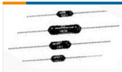
TE 产品编号 5-1879642-1 H8 5K0 0.1% 25PPM