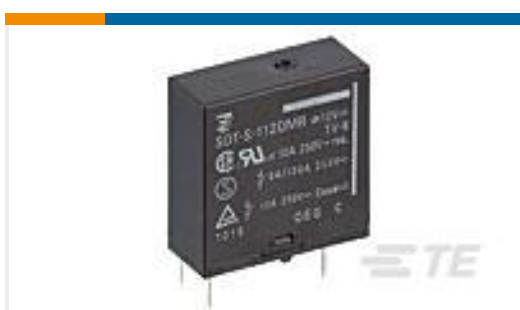
TE 产品编号1419126-2 SDT-S-124LMR,000