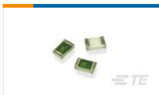
TE 产品编号1676349-2 RN 0805 47K5 0.1% 10PPM 1KRL