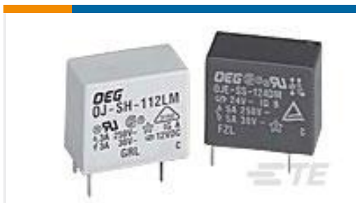
TE 产品编号 1461247-1 OJ-SH-106LMH,000