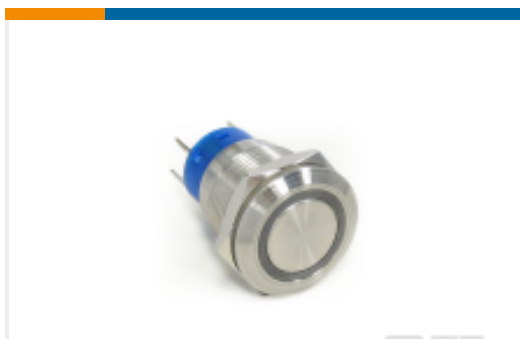
TE 产品编号 2-2213767-1 AV19 SPL 5A MOVE RING LED WHITE 12V