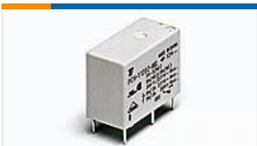
TE 产品编号 1461410-2 PCH-148D2,000