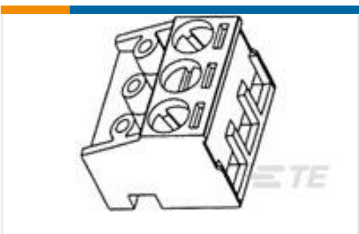
TE 产品编号 1546018-4 4 POS TERMI-BLOK PLUG 90 & 180