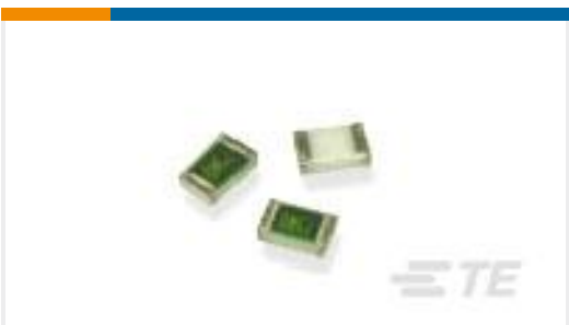
TE 产品编号 3-2176094-0 RP 2A 0.25W 243K 0.1% 25PPM 1K RL