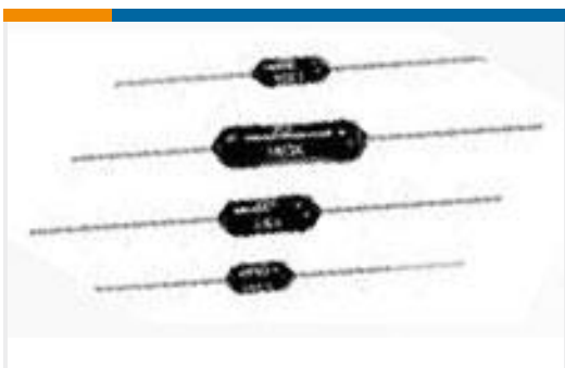
TE 产品编号 2-1879663-7 H8 200R 0.1% 15PPM