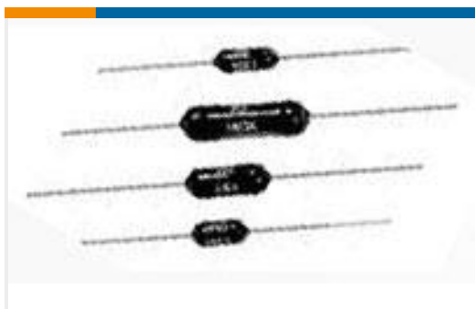
TE 产品编号 9-1879662-7 H8 100R 0.1% 15PPM