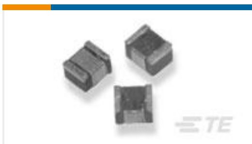
TE 产品编号 2176086-6 3654 0402 3.3nH 5% 2K RL