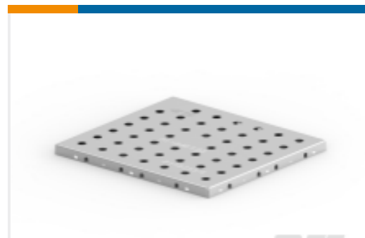
TE 产品编号2118723-4 STD SHIELD COVER, AL-37.33X34. 18X2.00MM