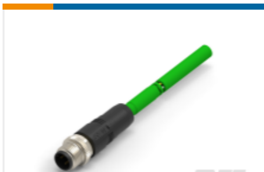
TE 产品编号TAD14141111-002 M12D4-MS-PVC TYPE B-1.0M