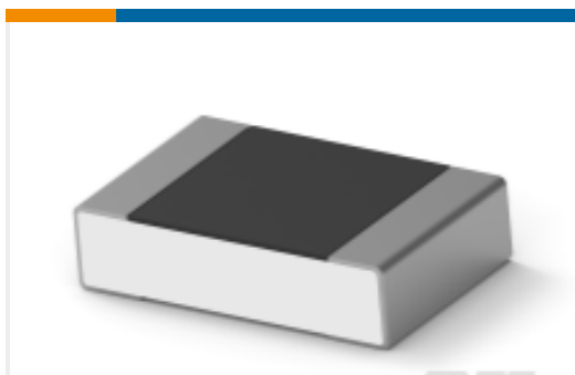
TE 产品编号2-2176378-6 RQ 0805 18R2 0.1% 10PPM 5K RL