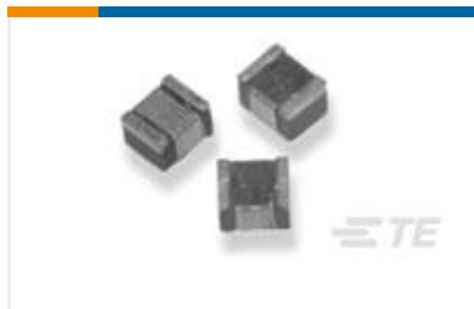
TE 产品编号1879023-1 3650 1008 5.6nH 5% 2K RL