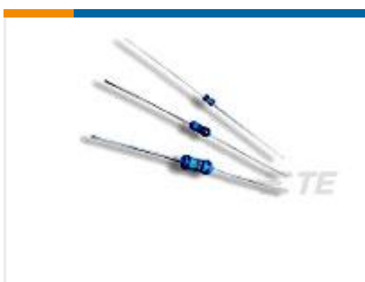
TE 产品编号1622360-1 LR1 1% 1K6