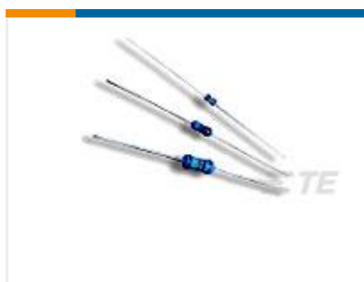
TE 产品编号1622406-1 LR1 1% 270R