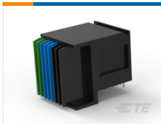
TE 产品编号1410189-4 MULTIGIG RT T2 7RW H-LFT,ET2