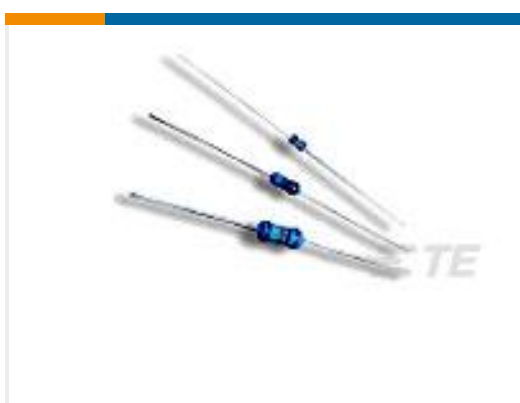
TE 产品编号1622323-1 LR1 1% 15K