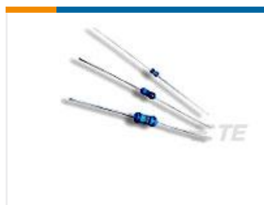
TE 产品编号1622531-1 LR1 1% 5K6