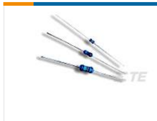
TE 产品编号1622296-1 LR1 1% 100K