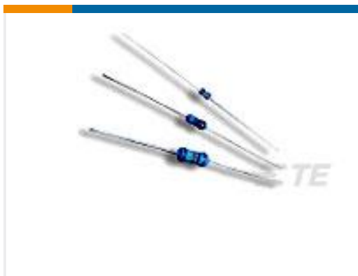
TE 产品编号1622442-1 LR1 1% 33R