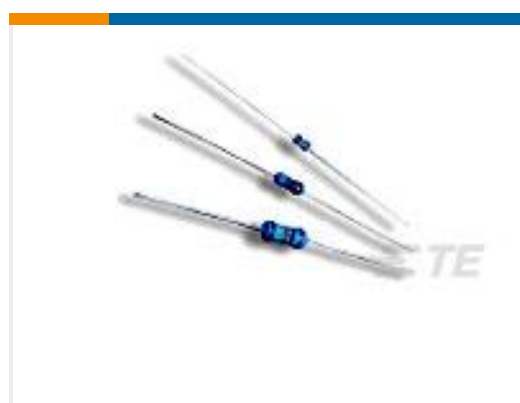
TE 产品编号1622447-1 LR1 1% 360R