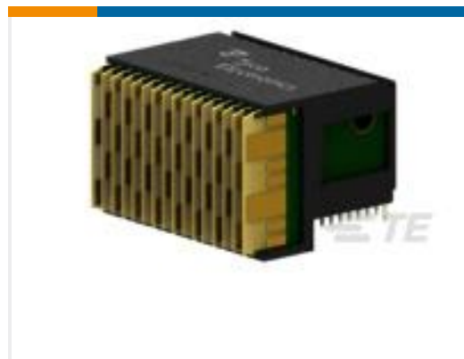
TE 产品编号1410187-4 MULTIGIG RT T2 7RW DC DF CT