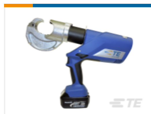
TE 产品编号2280308-1 KIT, BTLI, PISTOL GRIP, 12 TON