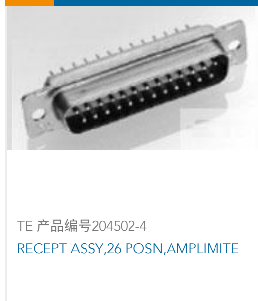
TE 产品编号204502-4 RECEPT ASSY,26 POSN,AMPLIMITE