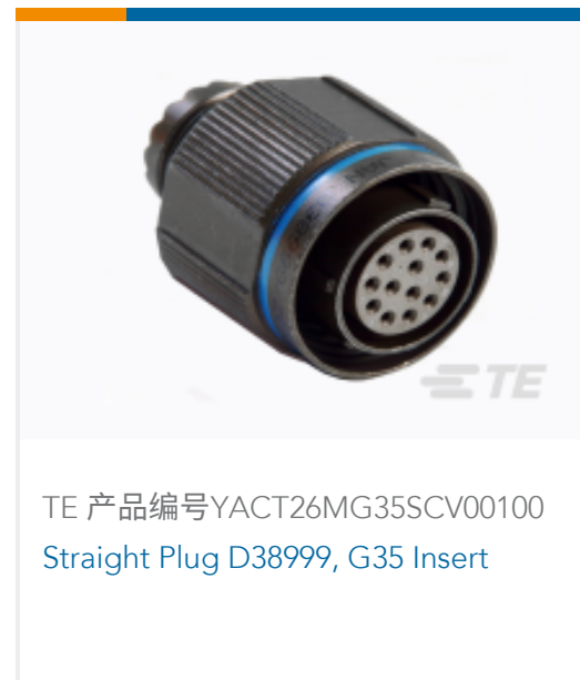
TE 产品编号YACT26MG35SCV00100 Straight Plug D38999, G35 Insert