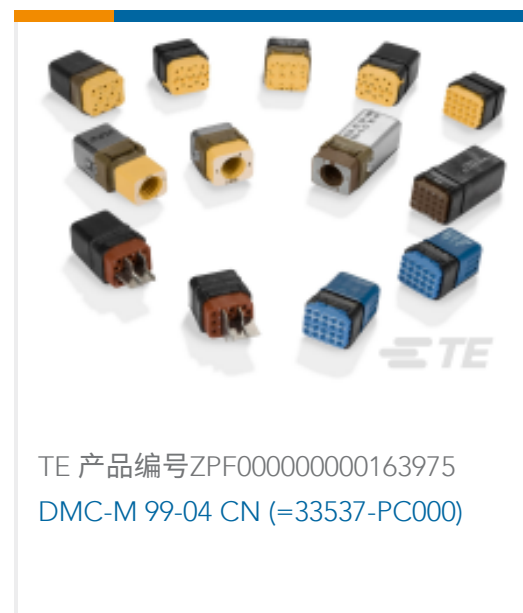
TE 产品编号ZPF000000000163975 DMC-M 99-04 CN (=33537-PC000)