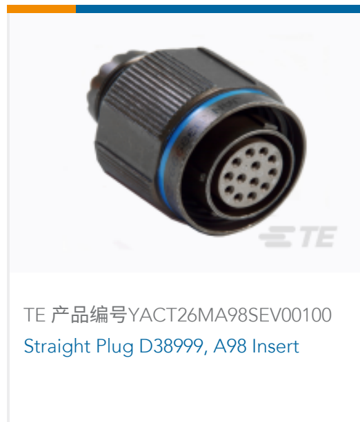
TE 产品编号YACT26MA98SEV00100 Straight Plug D38999, A98 Insert