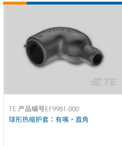
TE 产品编号EF9981-000 球形热缩护套：有嘴，直角