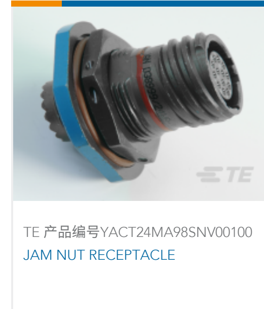
TE 产品编号YACT24MA98SNV00100 JAM NUT RECEPTACLE