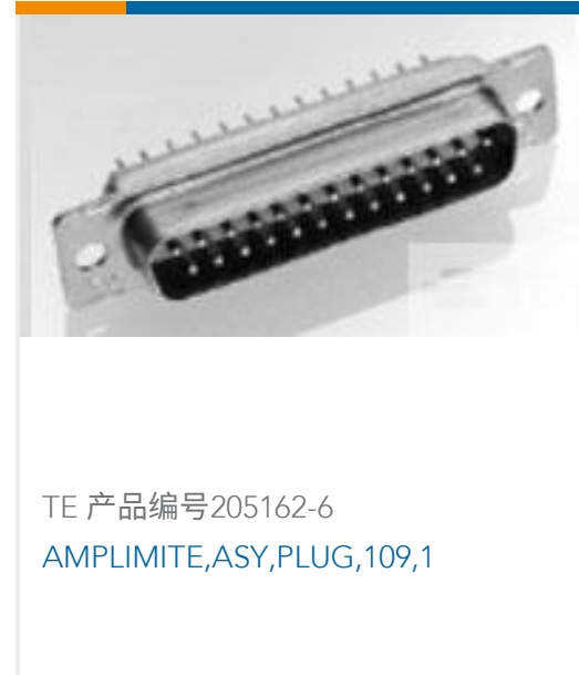
TE 产品编号205162-6 AMPLIMITE,ASY,PLUG,109,1