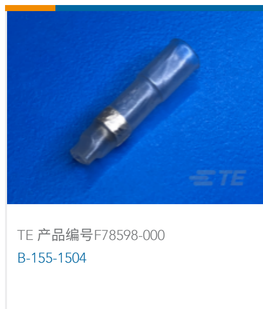
TE 产品编号F78598-000 B-155-1504