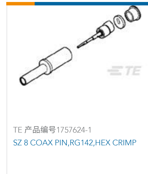
TE 产品编号1757624-1 SZ 8 COAX PIN,RG142,HEX CRIMP