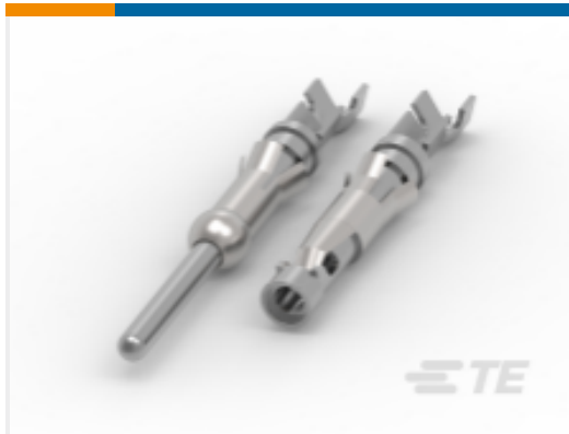
TE 产品编号1-66101-9 类型 III 端子低型面