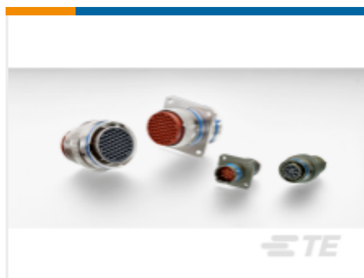
TE 产品编号YAFD54-14-12SNC012 RECP ASSY