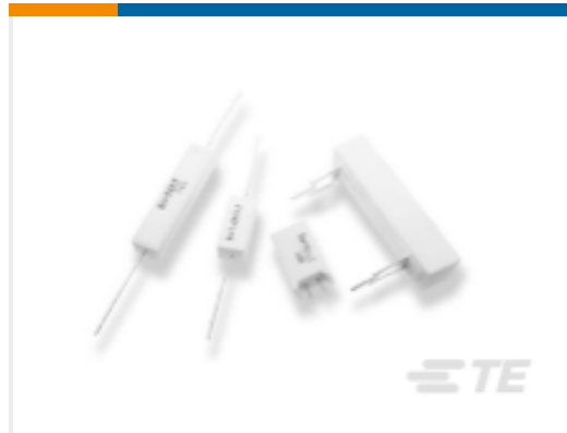
TE 产品编号1623802-4 线绕电阻器：水平安装