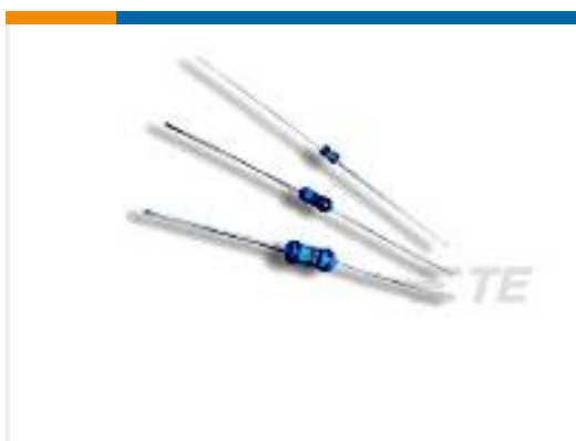
TE 产品编号1622796-6 YR1 0.1% 10K