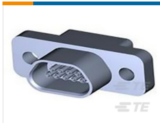
TE 产品编号1532206-2 M83513/02-FC, MCKS-C2-B-37SS