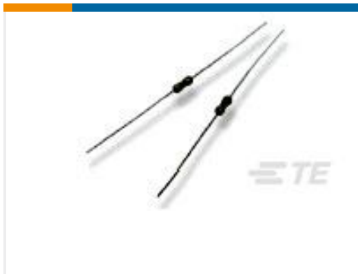
TE 产品编号1623708-1 RGP0207CH 5% 100M