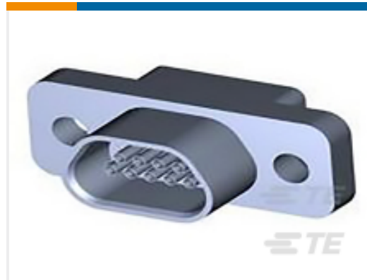
TE 产品编号1532214-1 M83513/01-FN, MCKS-N1-B-37PS