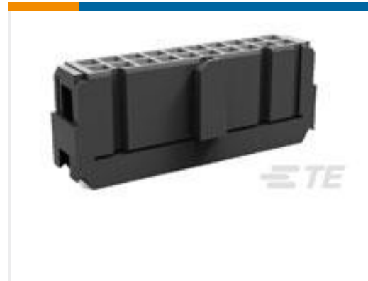
TE 产品编号1-1658621-1 60 NOVO MIL/CTR 15DP, LEAD FREE