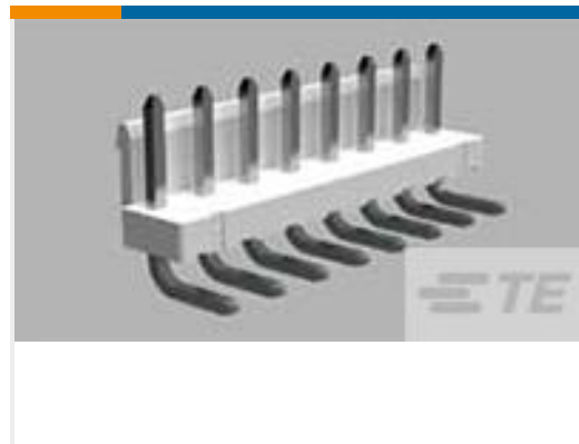
TE 产品编号1-647676-1 3.96 EP HDR ASSY 11P R/A