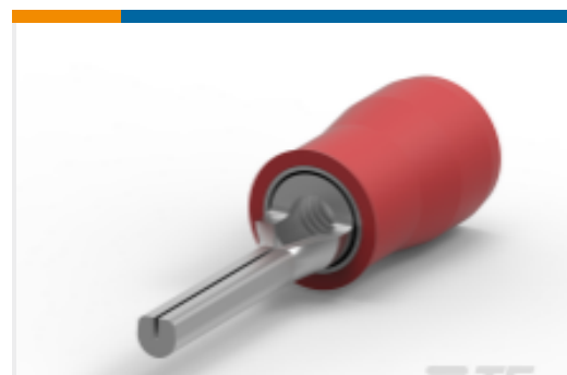
TE 产品编号2-1377174-5 SMP 0-0165590-1