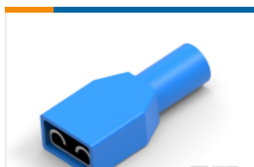
TE 产品编号3-1377175-4 SMP 0-0042241-2