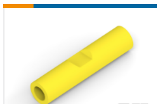
TE 产品编号5-1377173-8 SMP 0-0035115-0