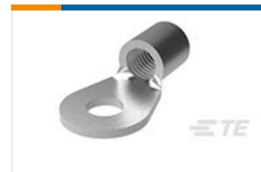
TE 产品编号3-1377172-6 SMP 0-0160000-0