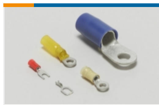
环形端子和叉形端子(862)