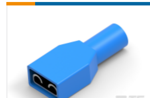
TE 产品编号1377175-7 SMP 9-0160313-5