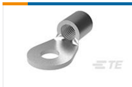
TE 产品编号2-1377172-3 SMP 0-0160032-0