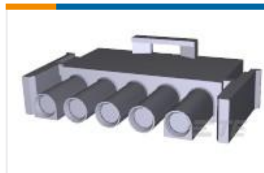
TE 产品编号1-480763-0 05P UMNL PLUG HSG NATL