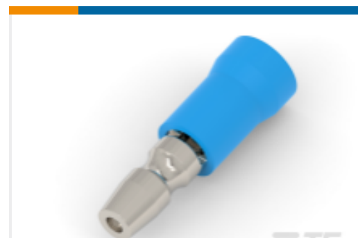
TE 产品编号2-1377174-7 SMP 0-0324227-0