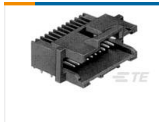
TE 产品编号1-104477-2 10 SYS50 HDR DRRA W/.145 SOLDE