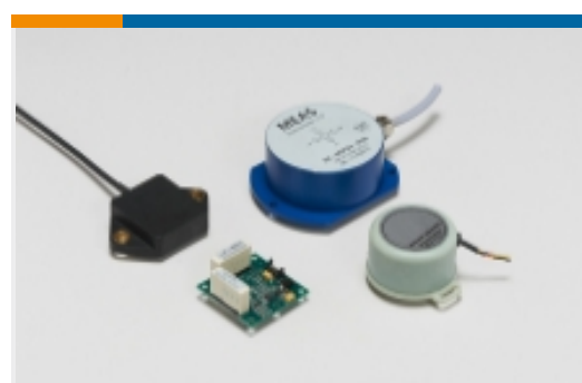
倾角传感器和倾角仪(1)