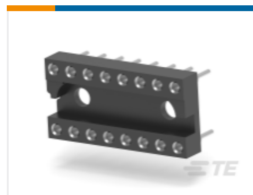
TE 产品编号1-1571551-2 DIP 插座：标准，冲压成型，封闭式，锡