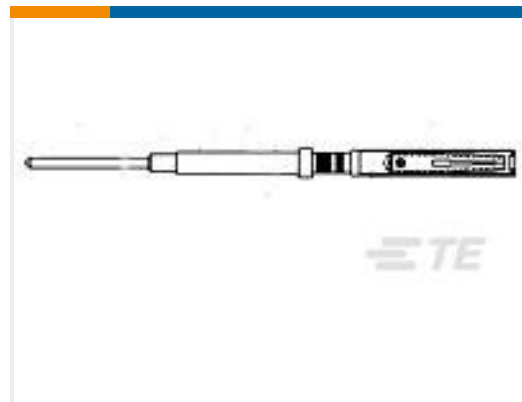
TE 产品编号1-211431-8 SKT CONTACT ASSY, SZ 22