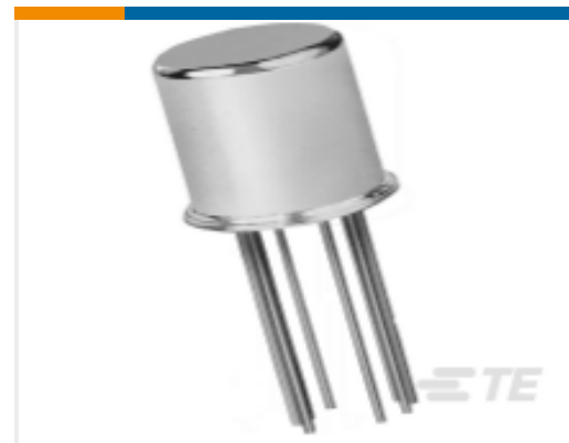
TE 产品编号1-1617119-1 J1MAW-6XL = M39016/7-015L