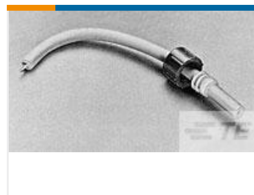
TE 产品编号445052-1 LGH 1 MLD END ELECTRICAL LEAD