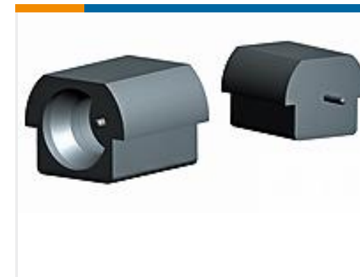
TE 产品编号1757640-2 SMPM MALE, PCB EDGE MOUNT, SMOOTH BORE