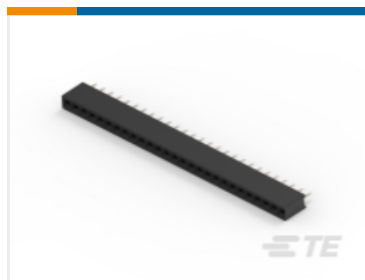
TE 产品编号2-535541-5 27 MODIV VRT SR CE 100/115