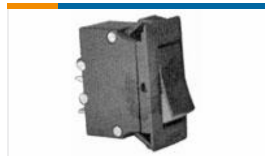
TE 产品编号1-1423673-6 W51-A151A1-7=CKTBKR,THERM, ROC