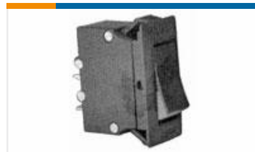
TE 产品编号4-1423673-0 W51-A152A1-10=CKTBKR,THERM, ROC