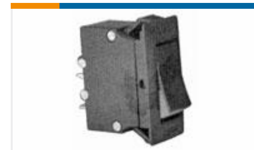
TE 产品编号3-1423673-9 W51-A152A1-5=CKTBKR,THERM,ROC