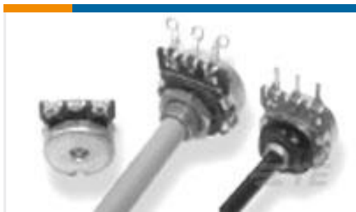
TE 产品编号1623767-2 23E 1MA 6.35X50FL B7 CAT