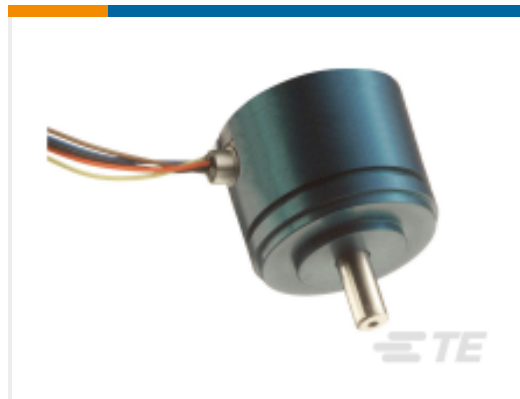
TE 产品编号02560231-140 R30A 10KHZ +/-40 DEGREES