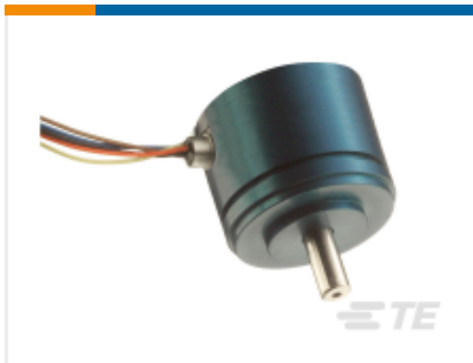
TE 产品编号02560231-000 RVDT R30A ASSY