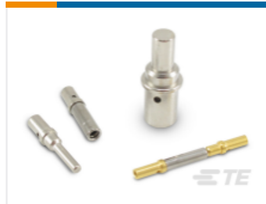
TE 产品编号0462-005-20141 DEUTSCH 实芯端子