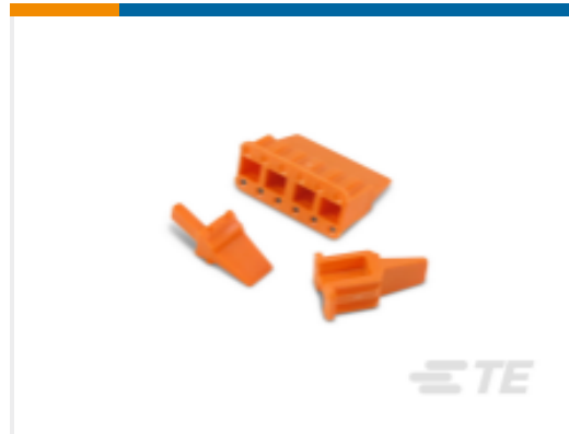
TE 产品编号WM-12S DEUTSCH DTM 楔形锁紧装置