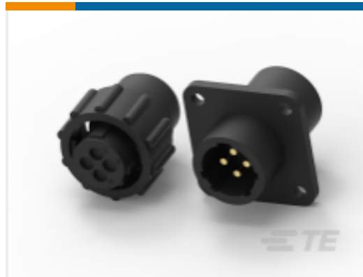
TE 产品编号211400-1 CPC 系列 1