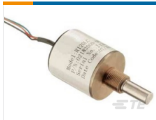
TE 产品编号66530072-000 R-FLEX CPLG ADP RVIT/RVDT/RSYN