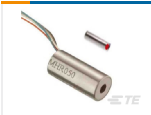
TE 产品编号02560408-000 小型轻量 LVDT