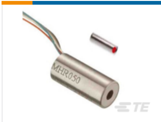
TE 产品编号02560408-000 小型轻量 LVDT