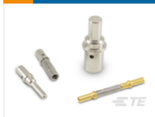
TE 产品编号0462-005-20141 DEUTSCH 实芯端子