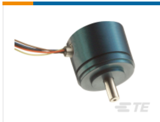
TE 产品编号02560231-140 R30A 10KHZ +/-40 DEGREES