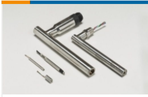
线性位移传感器 - LVDT(57)