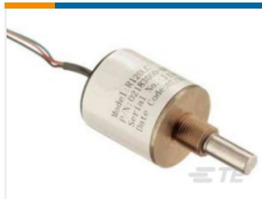
TE 产品编号66530072-000 R-FLEX CPLG ADP RVIT/RVDT/RSYN