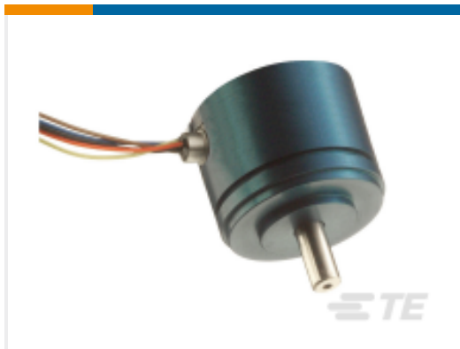
TE 产品编号02560231-000 RVDT R30A ASSY