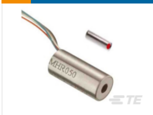
TE 产品编号02560408-000 小型轻量 LVDT