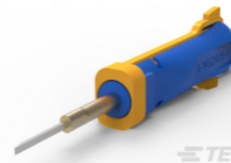
TE 产品编号 1452426-1 EXTRACTION TOOL