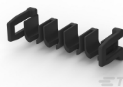
TE 产品编号 CAT-P87074-T669 三重锁定电源连接器端子锁定片