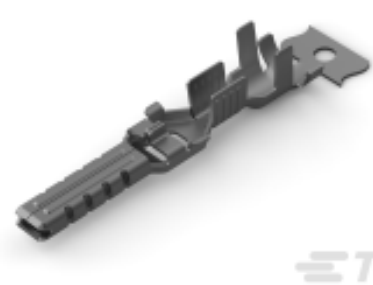
TE 产品编号 CAT-P87074-T111 三重锁定电源连接器公端端子