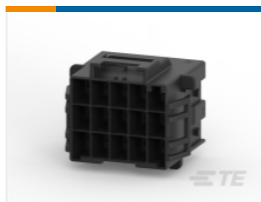
TE 产品编号 1-2232356-5 PTL 3X5 CAP PANEL MT HOT WIRE KEY A BLK