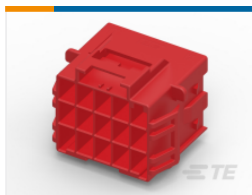
TE 产品编号 CAT-P87074-C1701A 三重锁定电源连接器高温帽