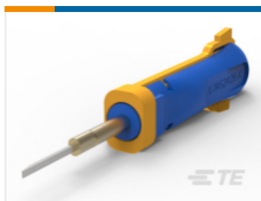
TE 产品编号 1452426-1 EXTRACTION TOOL