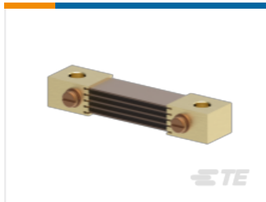
TE 产品编号CK0345-000 CI-FH5050