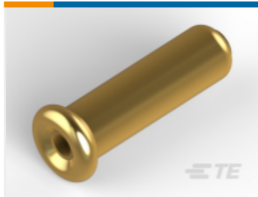
TE 产品编号3-330808-8 Mini Spring Sockets: Knockout Bottom, 3A