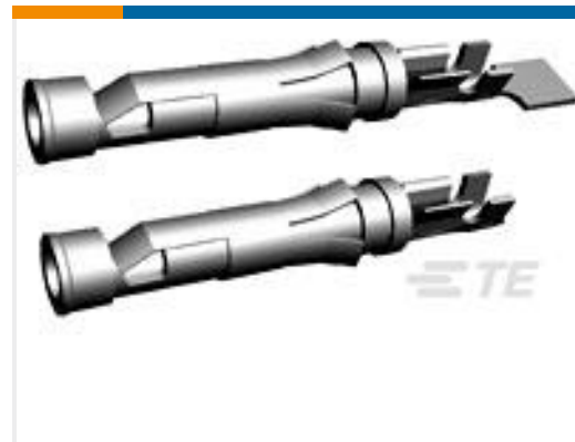
TE 产品编号2-66101-0 III+ SKT, 18-16, TIN, SMPACK