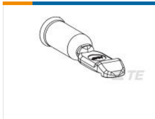
TE 产品编号1744041-1 L/P CONTACT, 12-16AWG