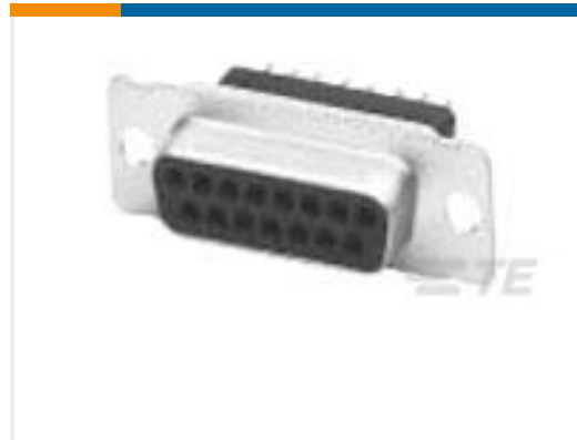
TE 产品编号5745183-1 09 RCPT SP/MS STD