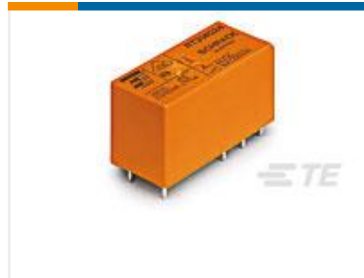
TE 产品编号8-1393239-0 RT314A12