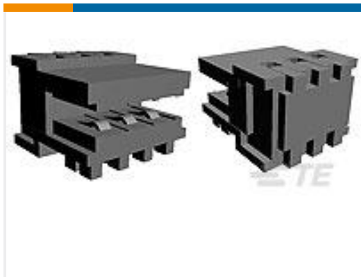
TE 产品编号3-829868-6 10X 6P FEDERLEI 2,5