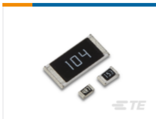
TE 产品编号2176346-1 CRGCQ 1210 1R0 5%