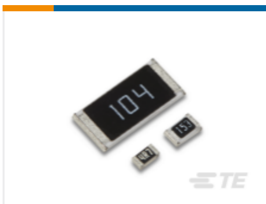
TE 产品编号2-2176338-1 CRGCQ 0402 2K2 5%