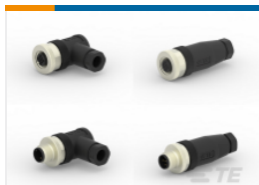
TE 产品编号 CAT-C73765-M1E M12 可现场安装非屏蔽式