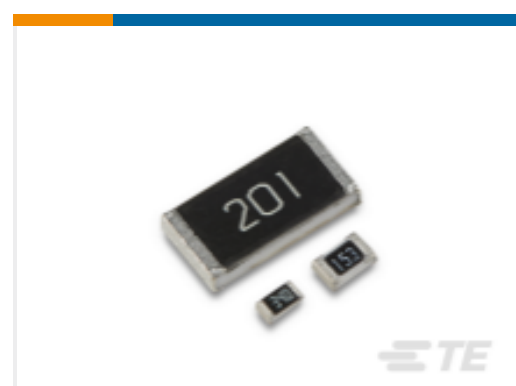
TE 产品编号6-2176327-1 CRGP 0805 1M0 1%