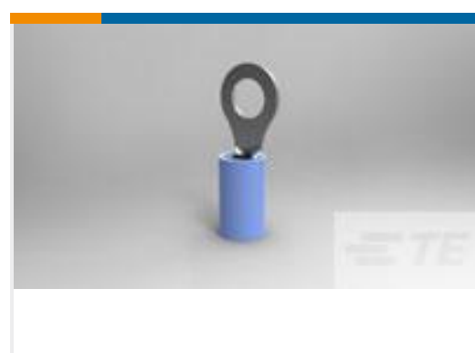
TE 产品编号130118 PIDG RING TONGUE