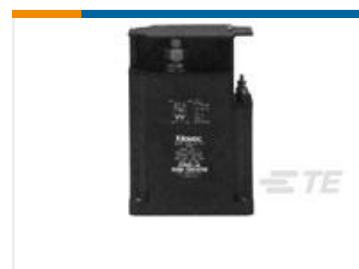
TE 产品编号4-1618002-5 EV500-4B=RELAY, PRESSURIZED, S