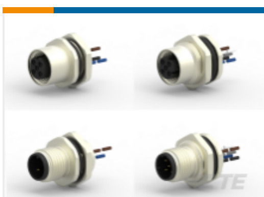
TE 产品编号T4171010402-001 M12 面板安装导线