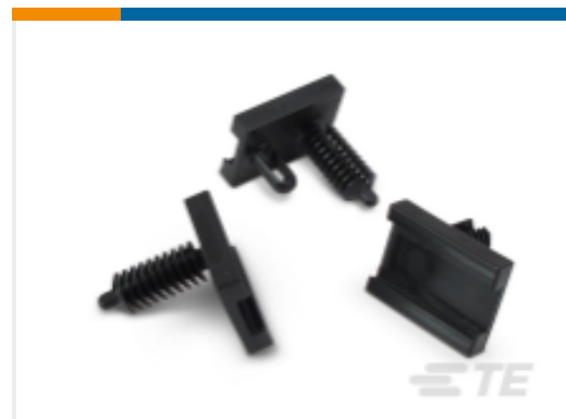
TE 产品编号1924487-3 AMPSEAL 16 安装卡箍