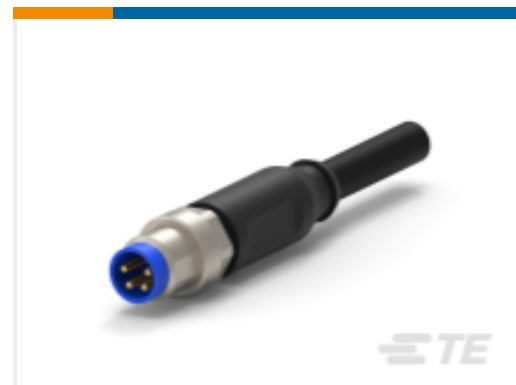
TE 产品编号2273000-4 M8 公端直角单头