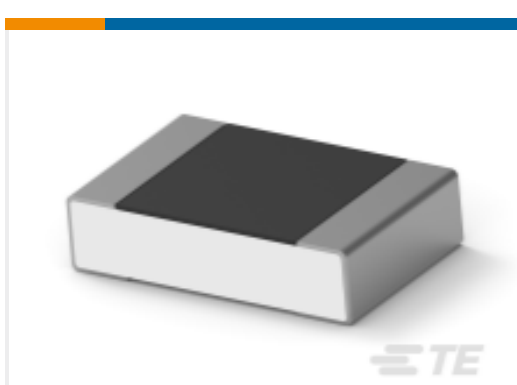
TE 产品编号2176378-2 RQ 0805 10R2 0.1% 10PPM 5K RL