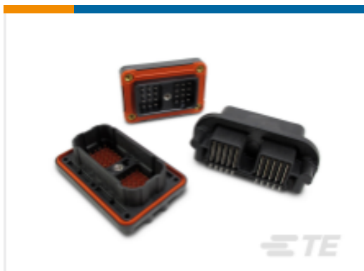
TE 产品编号DRC13-40PC DEUTSCH DRC 接头