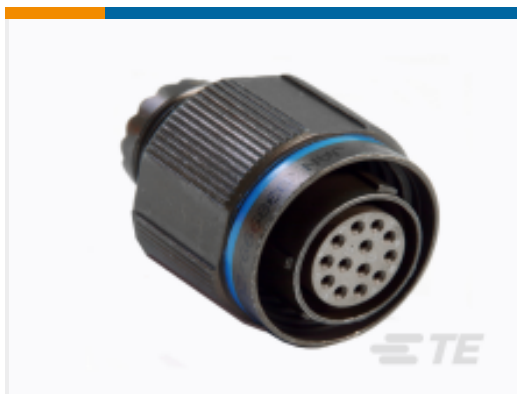
TE 产品编号 CAT-D38999-DTS18J Straight Plug: D38999, 11-98 Insert, Electroless Nickel Plating