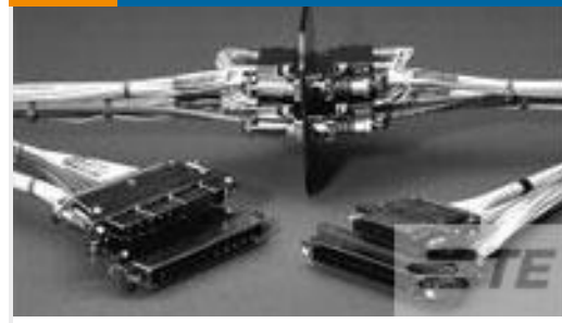
TE 产品编号335551-000 MTC100-JH2-P33