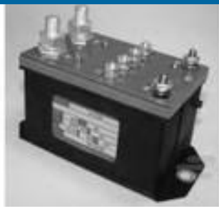
TE 产品编号1616058-2 A703AK=RELAY