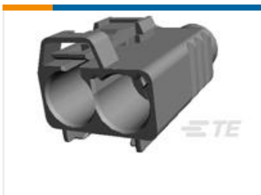
TE 产品编号2-1452483-3 2WAY PLUG CONN. 8MM PITCH