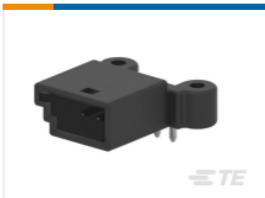
TE 产品编号1-1318745-0 信号接头