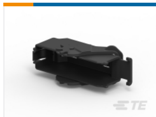
TE 产品编号1743710-2 MQS/MCP HYB26P COVER ASSY(RH)