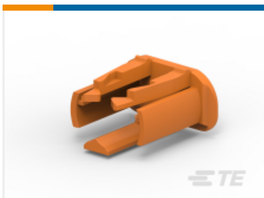
TE 产品编号2005512-1 SQUIB AK2 CPA