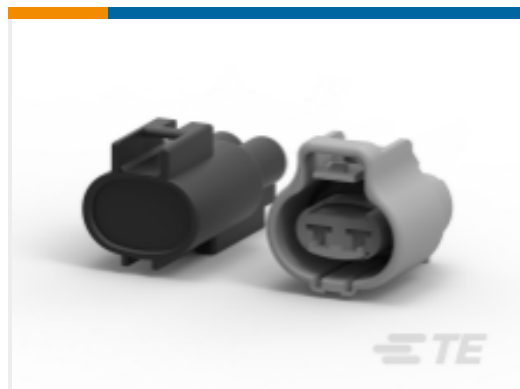
TE 产品编号1743193-1 ECONOSEAL, 连接器壳体