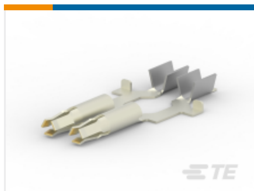
TE 产品编号2005939-3 SOCKET FOR SQUIB 2P AK-2