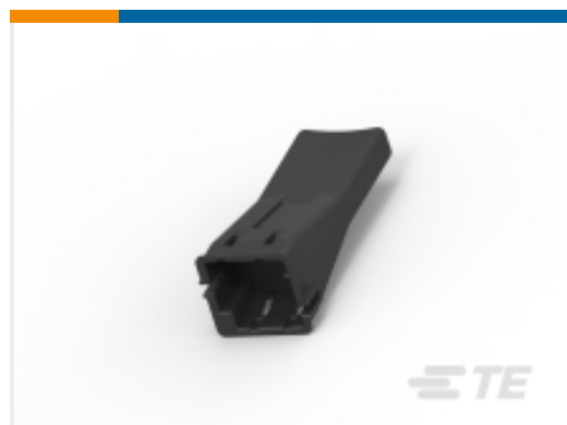
TE 产品编号2109120-2 BULB T20 EXTENSION COVER HSG