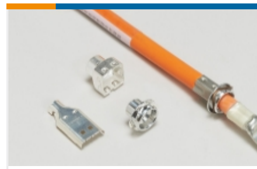
汽车连接器 EMC 屏蔽(2)