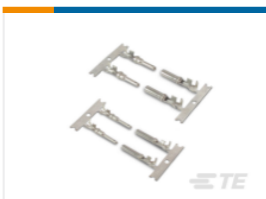
TE 产品编号1060-14-0122 DEUTSCH 冲压成型端子