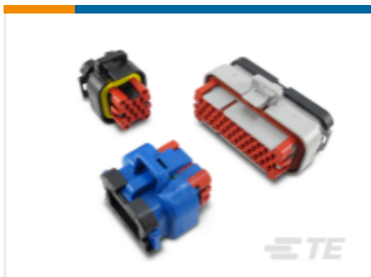
TE 产品编号770680-1 AMPSEAL 壳体