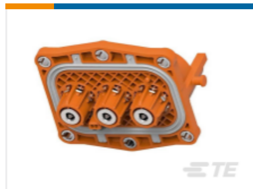
TE 产品编号2103247-1 高压接头