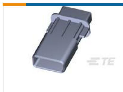
TE 产品编号2103321-1 3p Inner Hsg. Split Hdr, Key A, HVA280