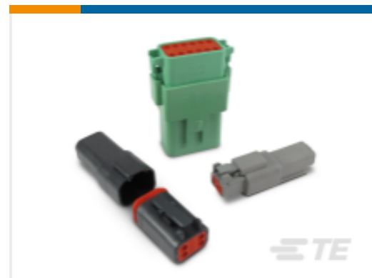
TE 产品编号DT04-6P-CE02 德驰 DT 系列塑壳和连接器