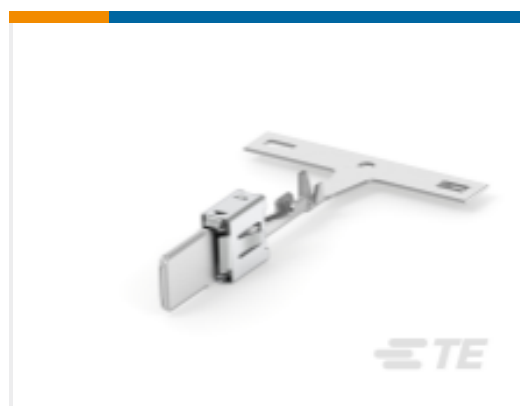
TE 产品编号1-965984-1 TAB 5.8x0.8 CONTACT CS SRC Sn