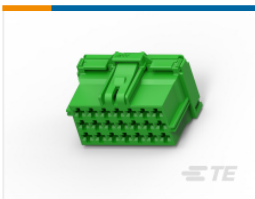
TE 产品编号284875-2 AMP MCP, 非密封连接器壳体