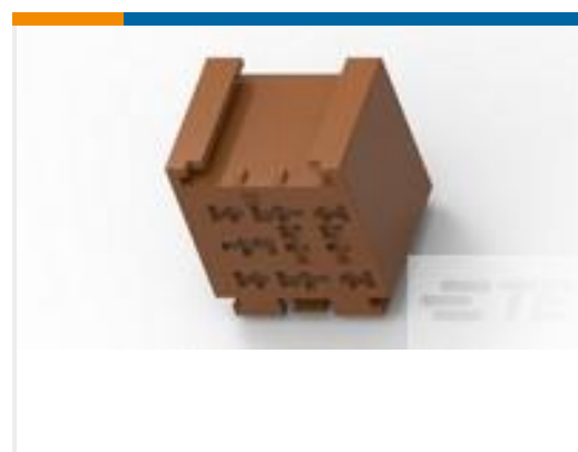
TE 产品编号185403-4 MODULAR RELAY HOLDER