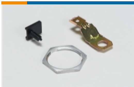
其他汽车连接器附件(13)