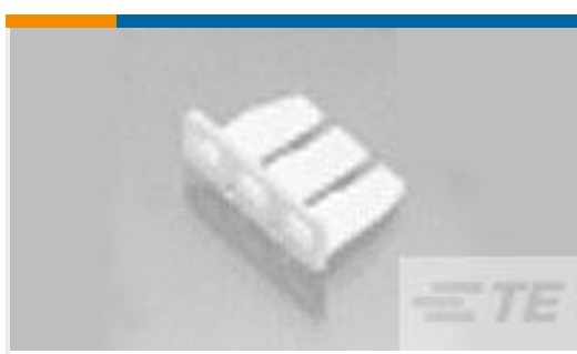
TE 产品编号282706-1 ECONOSEAL J DOUBLE-LOCK 3 WAY