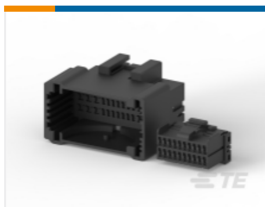
TE 产品编号284593-1 MULTILOCK, 连接器壳体