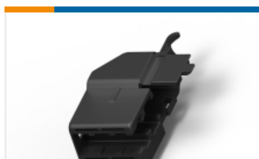
TE 产品编号1355360-1 TSP ABDECKKAPPE2X6P