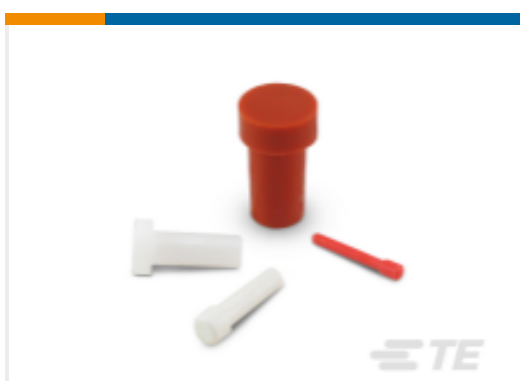
TE 产品编号114017-ZZ DEUTSCH 密封盲堵