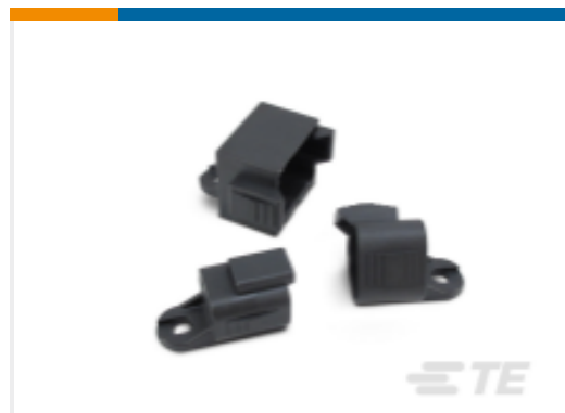
TE 产品编号1011-346-0405 DEUTSCH DT 防尘帽