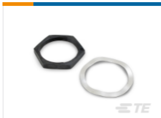
TE 产品编号2414-001-2486 DEUTSCH HDP20 安装硬件