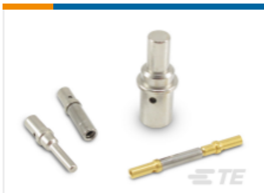
TE 产品编号0462-203-08141 DEUTSCH 实芯端子