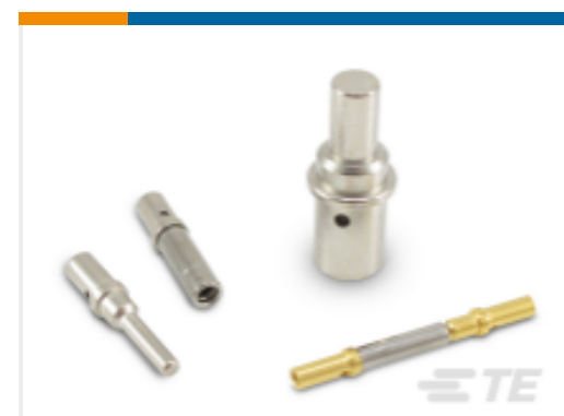
TE 产品编号0460-215-16141 DEUTSCH 实芯端子