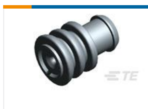
TE 产品编号828905-1 SINGLE-WIRE-SEAL(5MM HOLE)