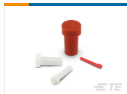
TE 产品编号0413-204-2005 DEUTSCH 密封盲堵