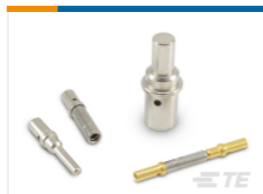
TE 产品编号0462-209-16141 DEUTSCH 实芯端子