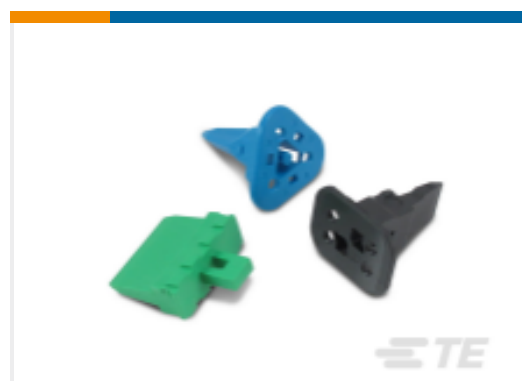
TE 产品编号W8S DEUTSCH DT 楔形锁紧装置