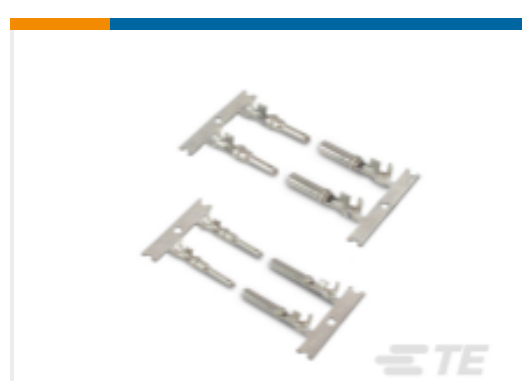
TE 产品编号1062-16-0122 DEUTSCH 冲压成型端子