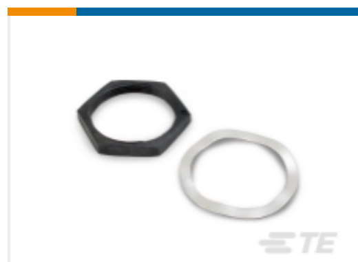
TE 产品编号2414-001-2486 DEUTSCH HDP20 安装硬件